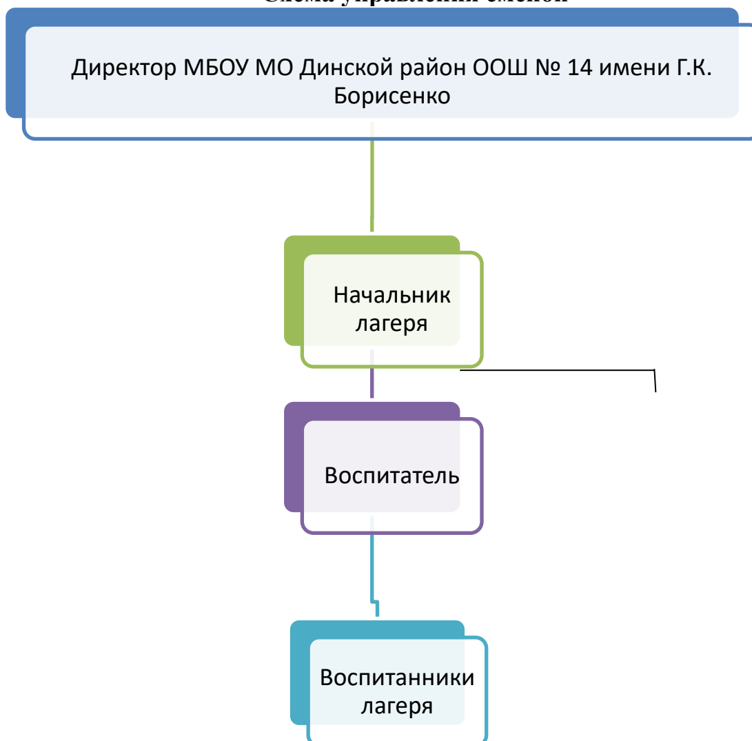
Схема управления сменой