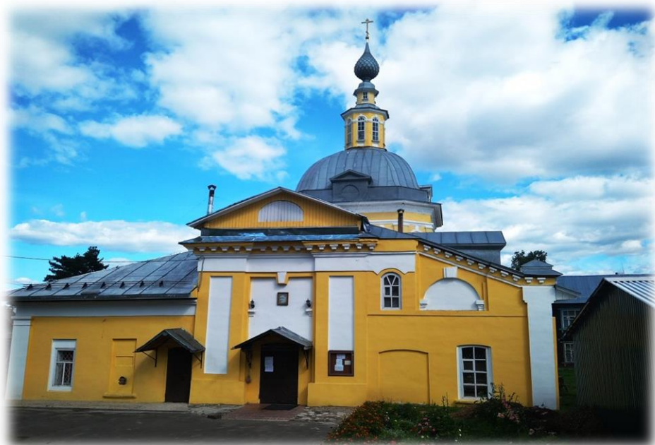
Храм Рождества Христова Юрьевец