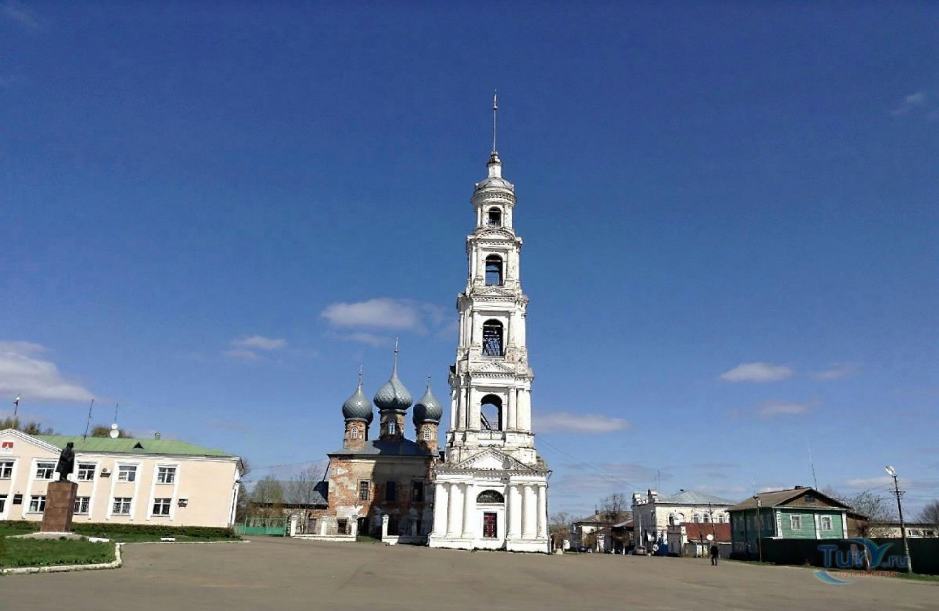
Колокольня Георгия Победоносца в Юрьевце