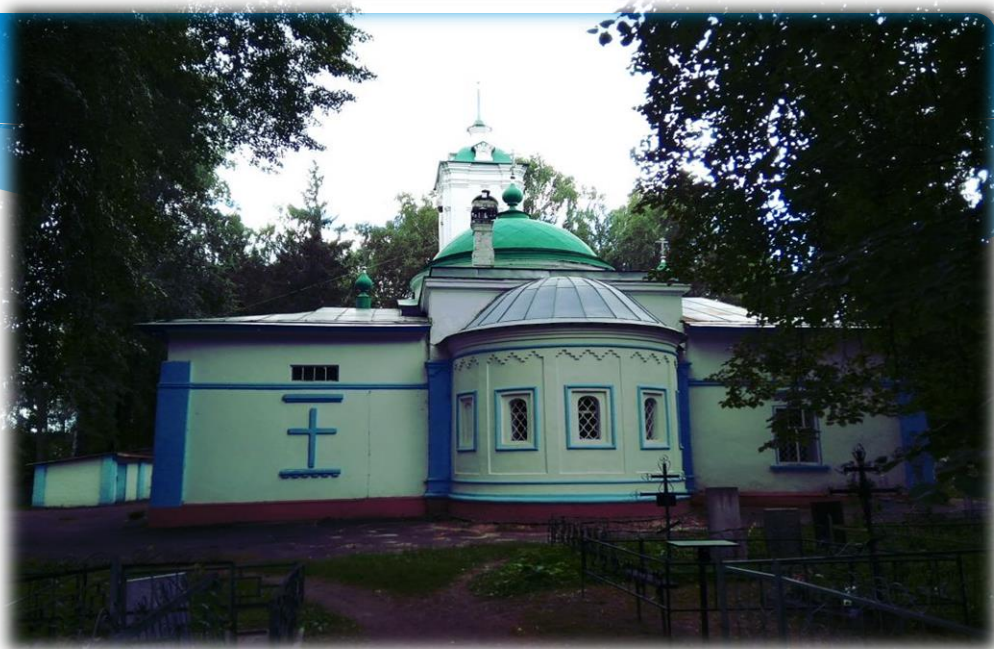
Церковь Сошествия Святого духа Юрьевец

Побродив по Юрьевцу, можно найти ещё несколько замечательных церквей. К примеру, церковь Сошествия Св. Духа 1839 г. постройки, которая стоит у старого кладбища. Или небольшую церковь Рождества Христова, выстроенную в 1815 г.