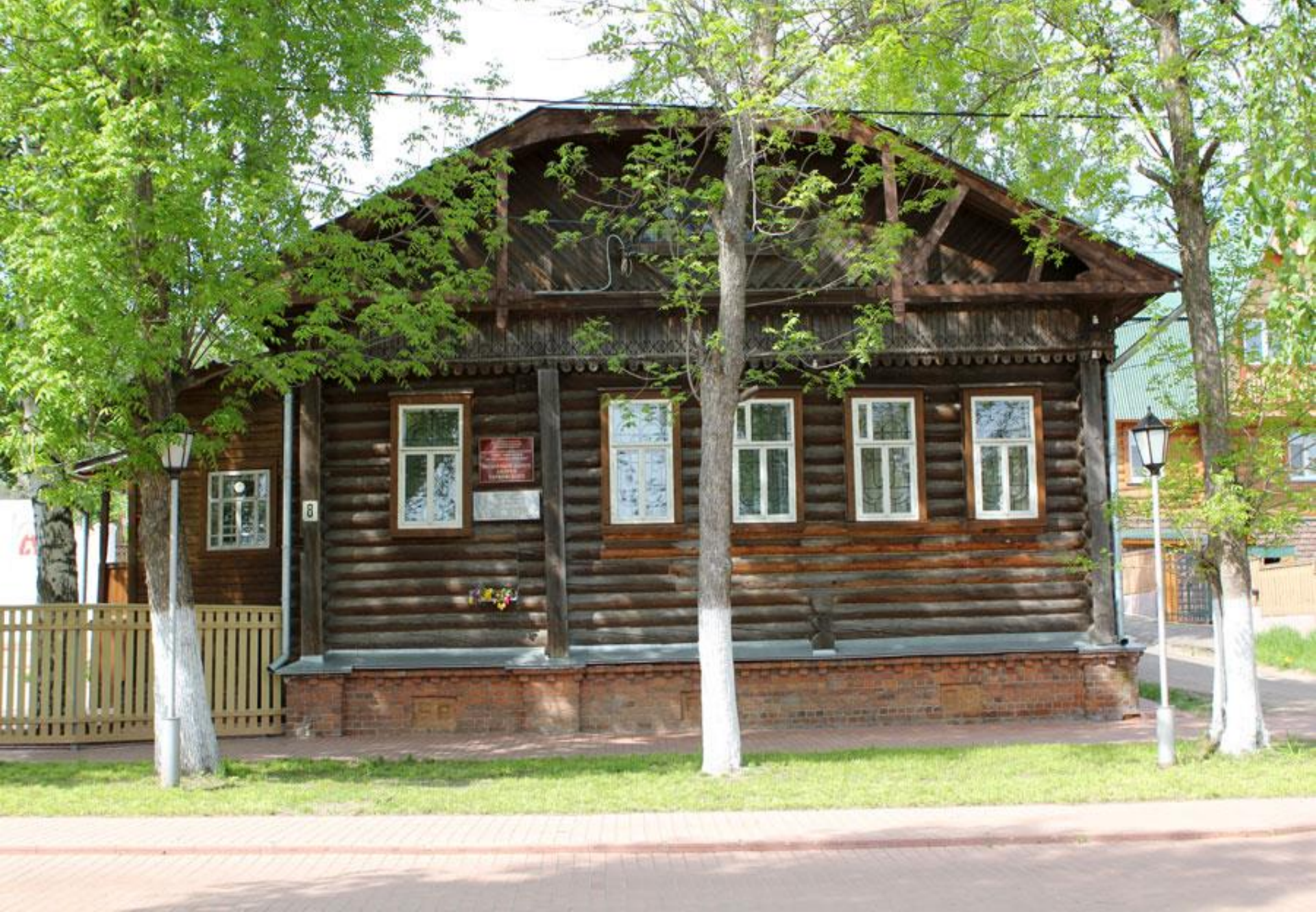
Музей Андрея Тарковского в Юрьевце