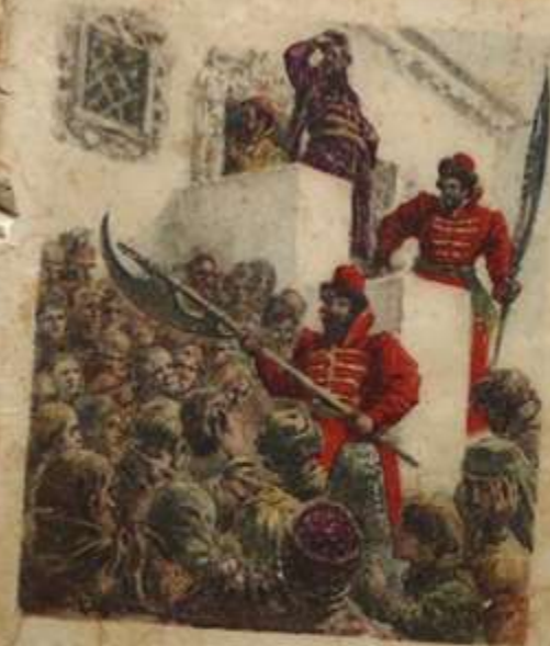
А. С. ПУШКИН БОРИС ГОДУНОВ

Пушкин завершает начатое в Одессе стихотворение «Разговор книгопродавца с поэтом». Осенью 1824 г. он обдумывает сюжет народной драмы «Борис Годунов» (окончена 7 ноября 1825), пишет шуточную поэму «Граф Нулин». В 1825 году встречается в соседнем имении Тригорском Анну Керн, которой посвящает стихотворение «Я помню чудное мгновенье...». В конце 1825 — начале 1826 года завершает пятую и шестую главы романа «Евгений Онегин». В последние дни Михайловской ссылки поэт пишет стихотворение «Пророк».