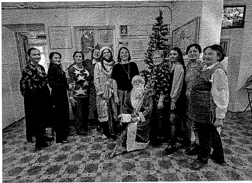
Встреча Нового 2024 года!