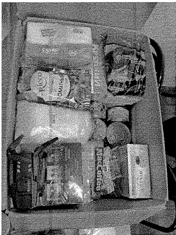
Гуманитарная помощь участникам СВО