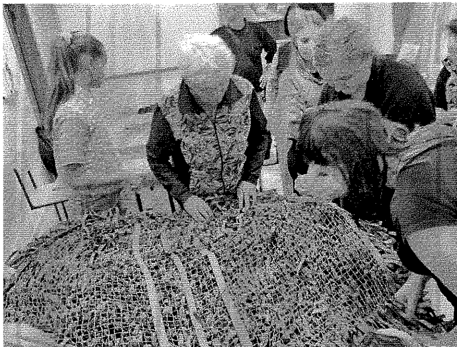
Плетение маскировочных сетей.

Работники БОУ ОСОШ регулярно принимают участие в сборе гуманитарной помощи для военнослужащих, участвующих в специальной военной операции.