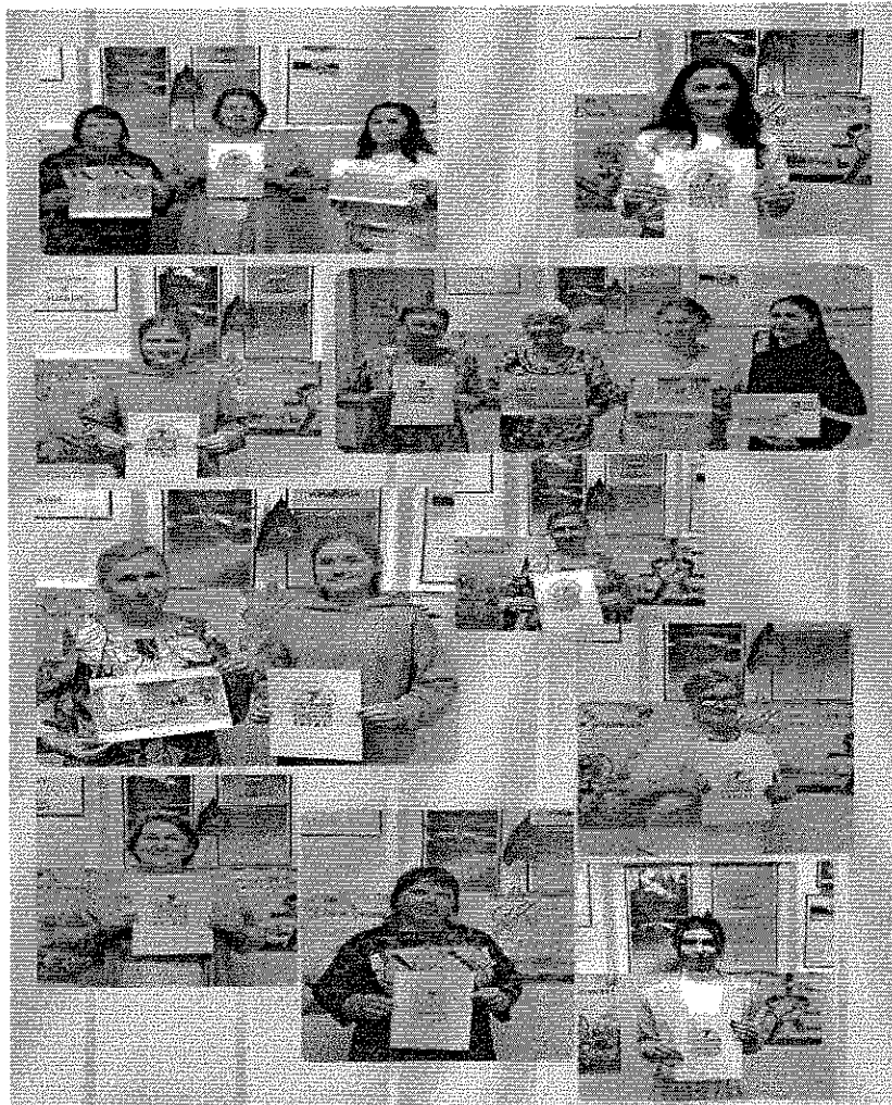
Акция «За достойный труд!»