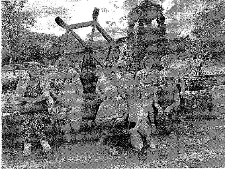
Отдых на природе (г.Горячий ключ)

Не остаются без внимания учителя – ветераны труда, неработающие пенсионеры. Доброй традиции стало поздравление их с праздниками, днями рождениями.