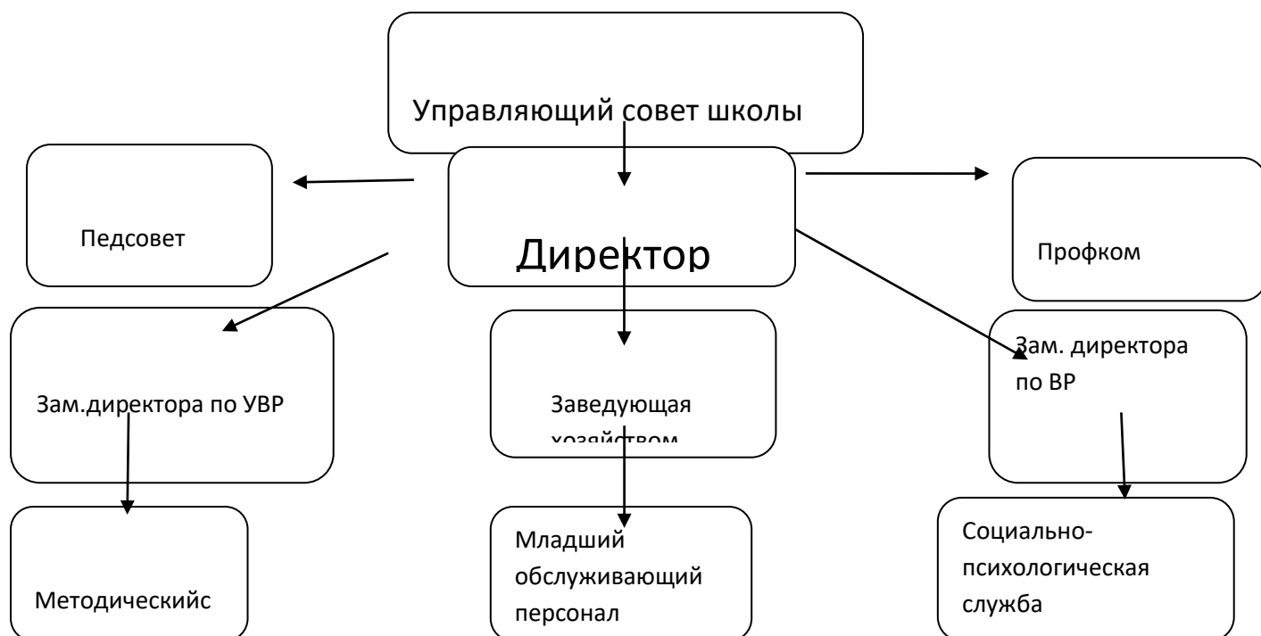
Схема структуры управления

Управляющий совет – педагогический совет – директор – руководители структурных подразделений