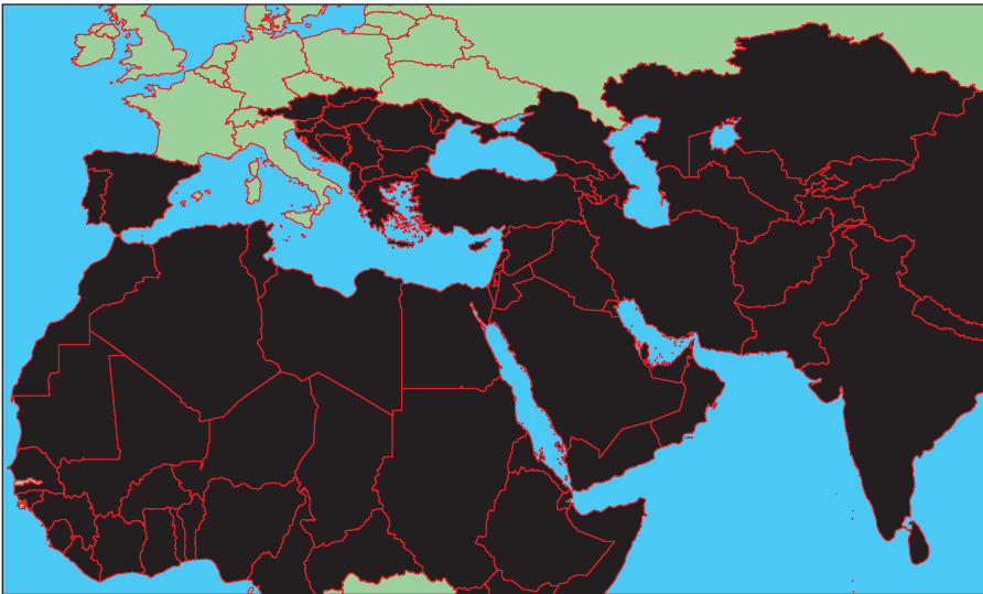
Карта мироустройства ИГИЛ

В настоящий момент группировка контролирует часть территории Сирии, а также ряд провинций в Ираке.