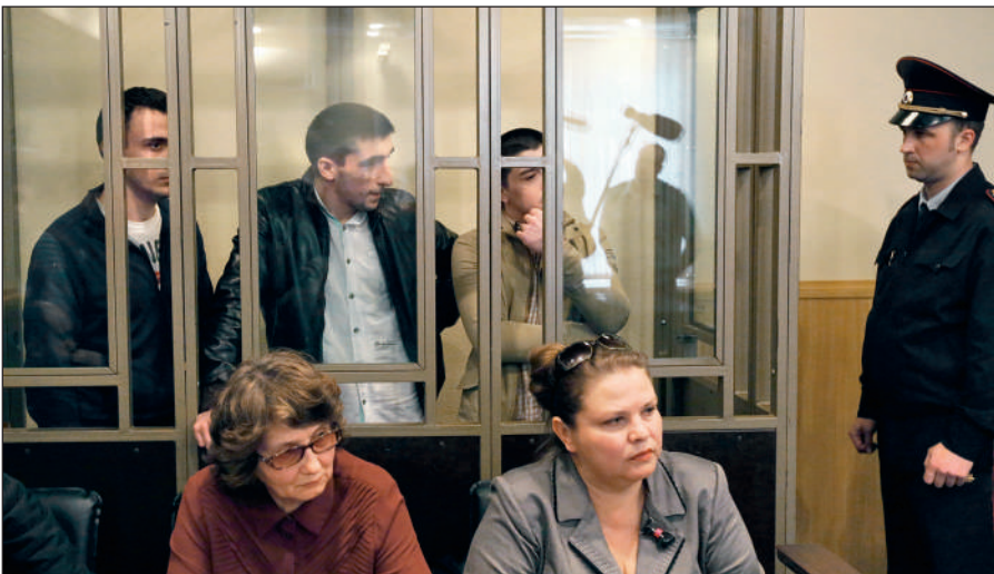
В Российской Федерации предусмотрена административная и уголовная ответственность за пропаганду идей терроризма, участие в деятельности террористических организаций.