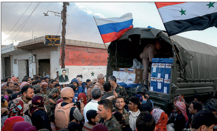
Россия оказывает гуманитарную помощь Сирии.