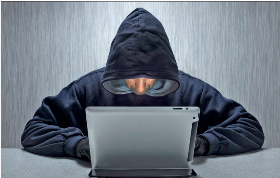
Вербовщики ИГИЛ активно используют Интернет.

Террористы день ото дня совершенствуют методы вербовки новых сторонников, а также алгоритмы их идеологической обработки. Читателю стоит помнить, что те типовые ситуации, которые описаны в данном пособии, можно рассматривать лишь в качестве базовых ориентиров,