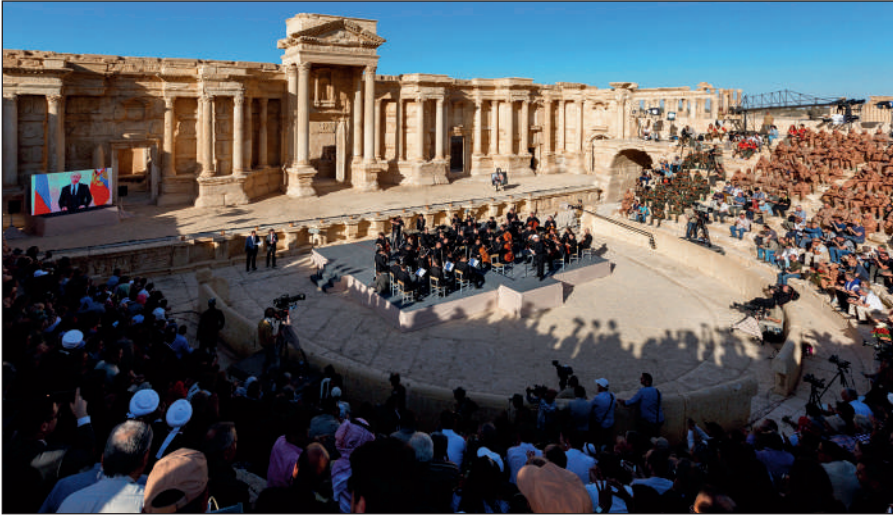
Освобожденная Пальмира. На концерте симфонического оркестра петербургского Мариинского театра под руководством народного артиста России Валерия Гергиева в Римском амфитеатре сирийской Пальмиры, освобожденной от террористов ИГИЛ.