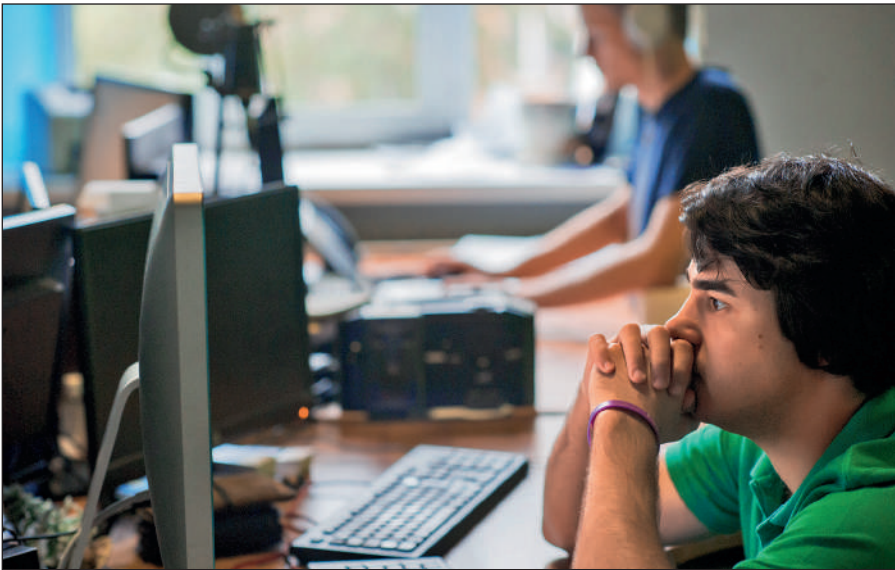
Постоянное присутствие вербовщиков ИГИЛ в соцсетях.

Активисты ИГИЛ поддерживают свои аккаунты в сетях Facebook, Twitter, Instagram, Friendica, Telegram. Активно они заявили о себе и в российских социальных сетях: «ВКонтакте» и «Одноклассниках».