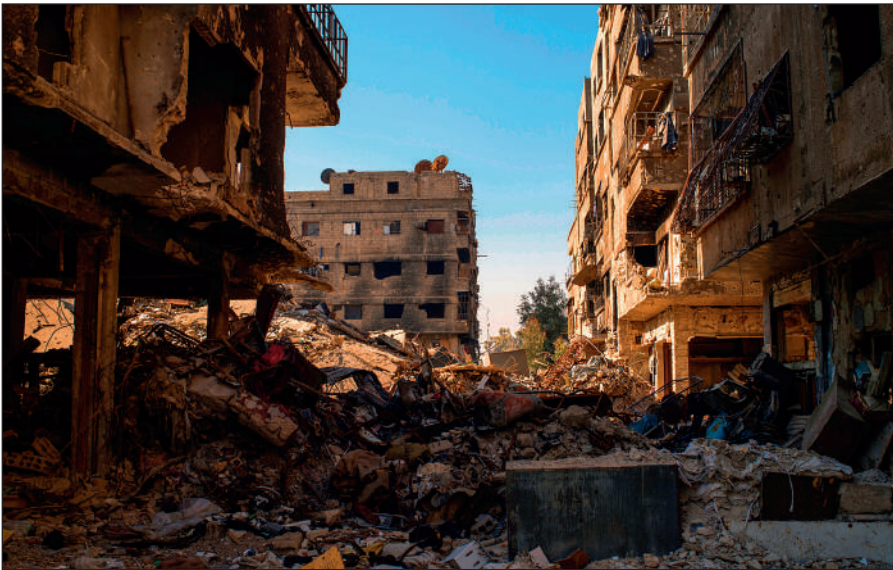
Разрушенный боевиками ИГИЛ Дамаск.

Террористы поставили на поток производство видеороликов с жестокими сценами казней пленников, заложников и «вероотступников». Эти материалы потом широко распространяются в социальных сетях и