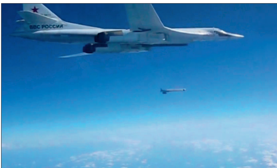
Воздушная операция российских ВКС по уничтожению боевиков ИГИЛ в Сирии.