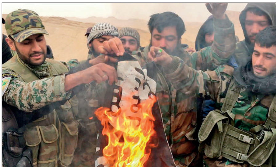
Народные ополченцы САР сжигают флаг ИГИЛ, снятый с отбитой у боевиков цитадели Пальмира.

Современное государство обязано защищать интересы каждого своего гражданина вне зависимости от его расы, национальности, принадлежности к определенной конфессии или религиозной традиции, в то время как ИГИЛ выражает интересы небольшой группы религиозных радикалов, жестоко подавляя остальную часть населения посредством запугивания, насилия и террора.