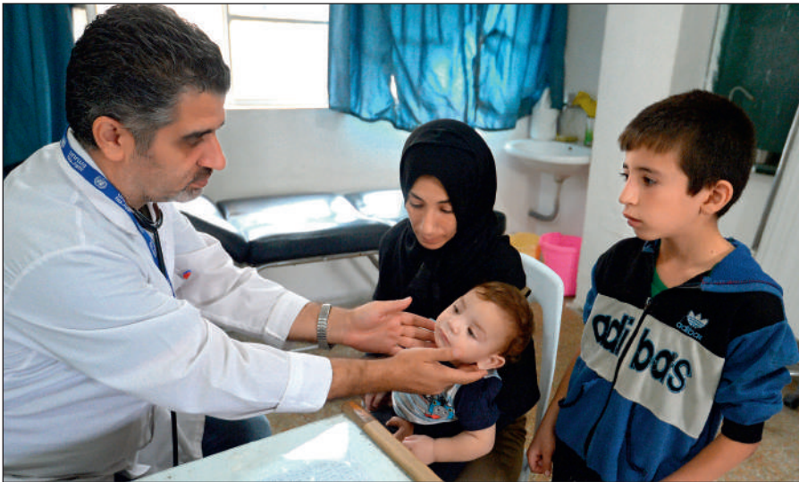
Истинный ислам призывает к состраданию и милосердию. Врач осматривает ребенка в медицинском пункте лагеря при одной из школ Дамаска.

Радикалы объявляют «врагами ислама» всех несогласных с ними мусульман. Ультрарадикальные группировки признают террор и насилие единственным способом достижения провозглашенных ими целей.