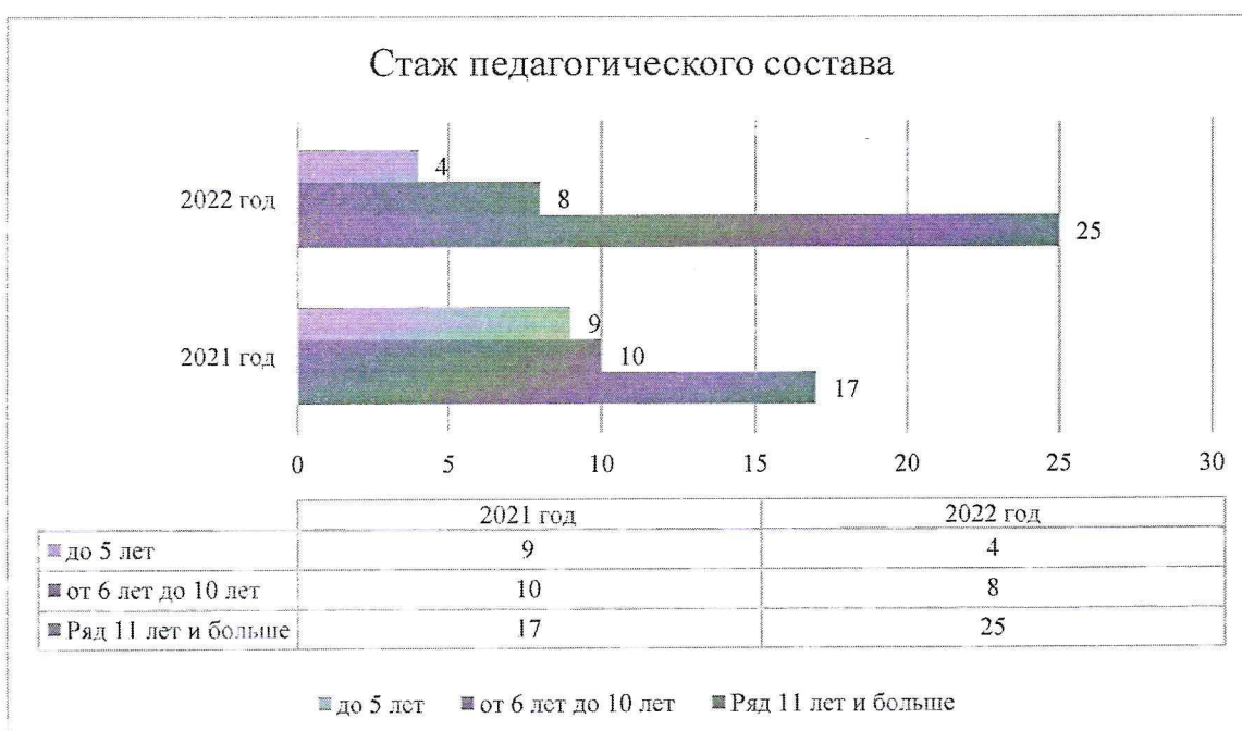
Гистограмма с характеристиками кадрового состава детского сада

По итогам 2022 года детский сад перешел на применение профессиональных стандартов. Все педагоги соответствуют квалификационным требованиям профстандарта «Педагог». Их должностные инструкции соответствуют трудовым функциям, установленным профстандартом «Педагог».