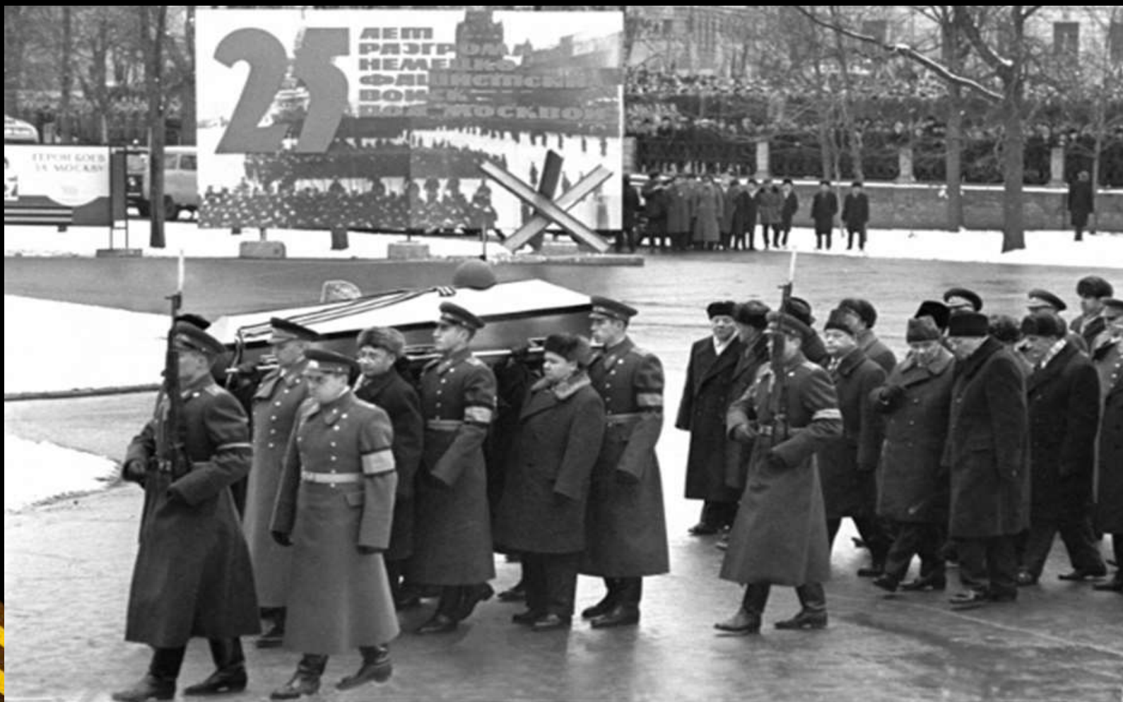
Захоронение праха Неизвестного солдата у Кремлевской стены, 3 декабря 1966 года