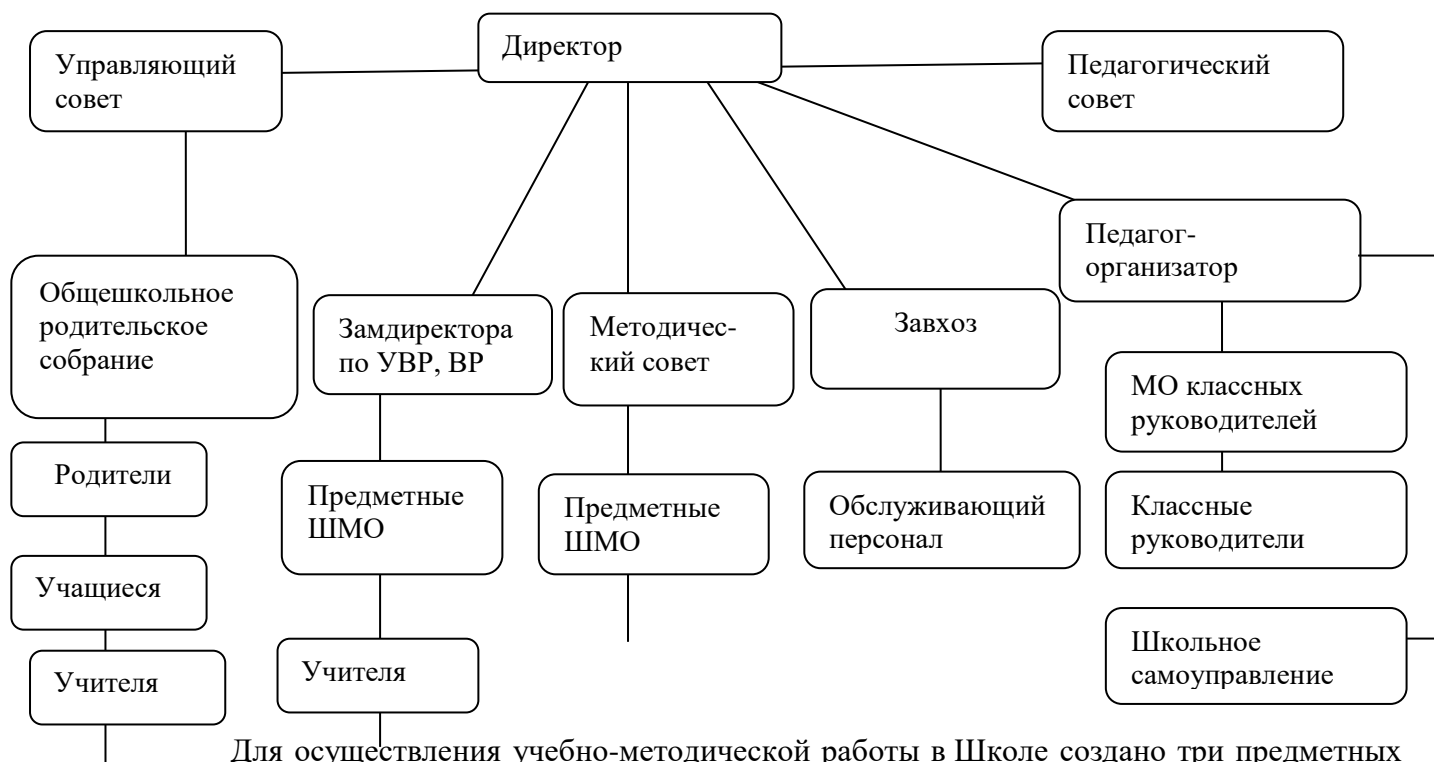
Схема структуры управления

Для осуществления учебно-методической работы в Школе создано три предметных методических объединения: