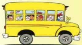
СХЕМА БЕЗОПАСНОГО МАРШРУТА ШКОЛЬНИКА