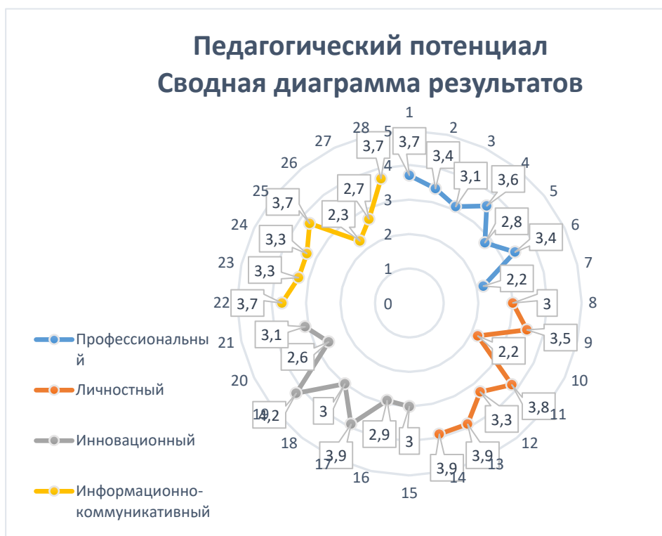
Схема 2. Педагогический потенциал. Сводная диаграмма результатов.

Характеристика показателей педагогического потенциала находит свое отражение в объективных показателях оценки собственной профессиональной деятельности педагогических работников Центра. Для выявления уровня их сформированности в рамках Программы развития ЦДТ на 2019 – 2025 годы был разработан опросник «Педагогический потенциал». В опросе приняли участие 61 педагог дополнительного образования ЦДТ. Его результаты представлены на схеме 2.