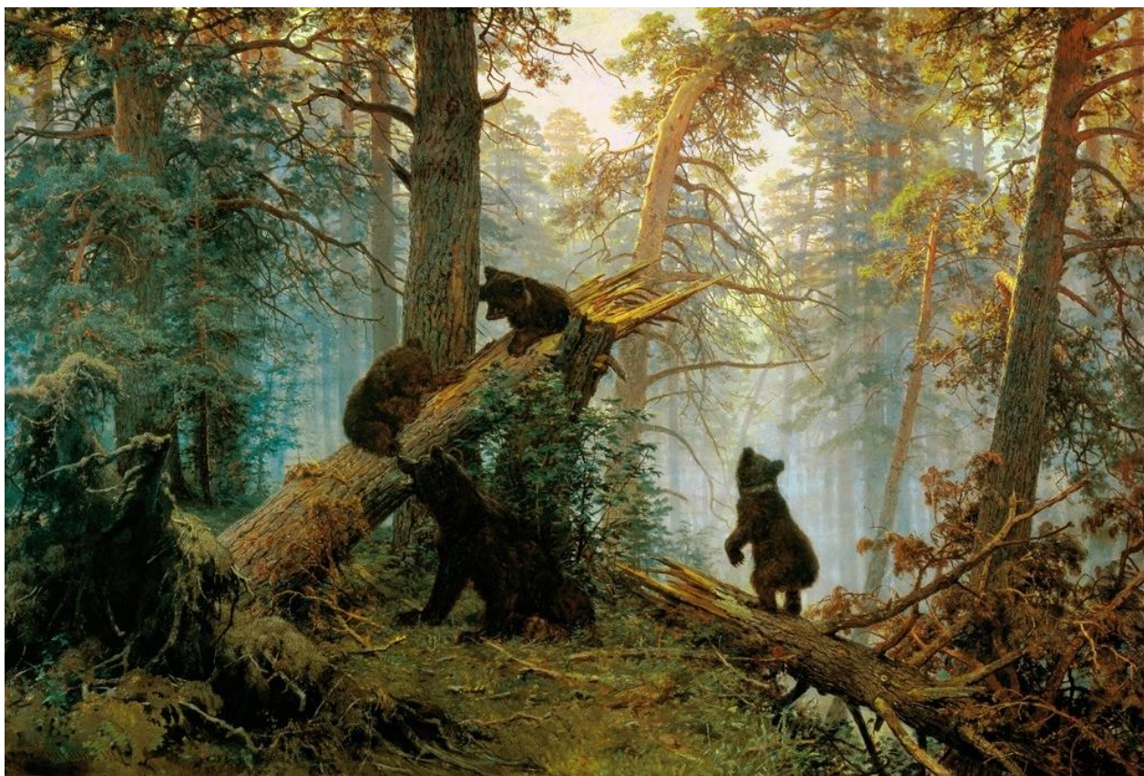
Картина «Утро в сосновом лесу» 1889 г.