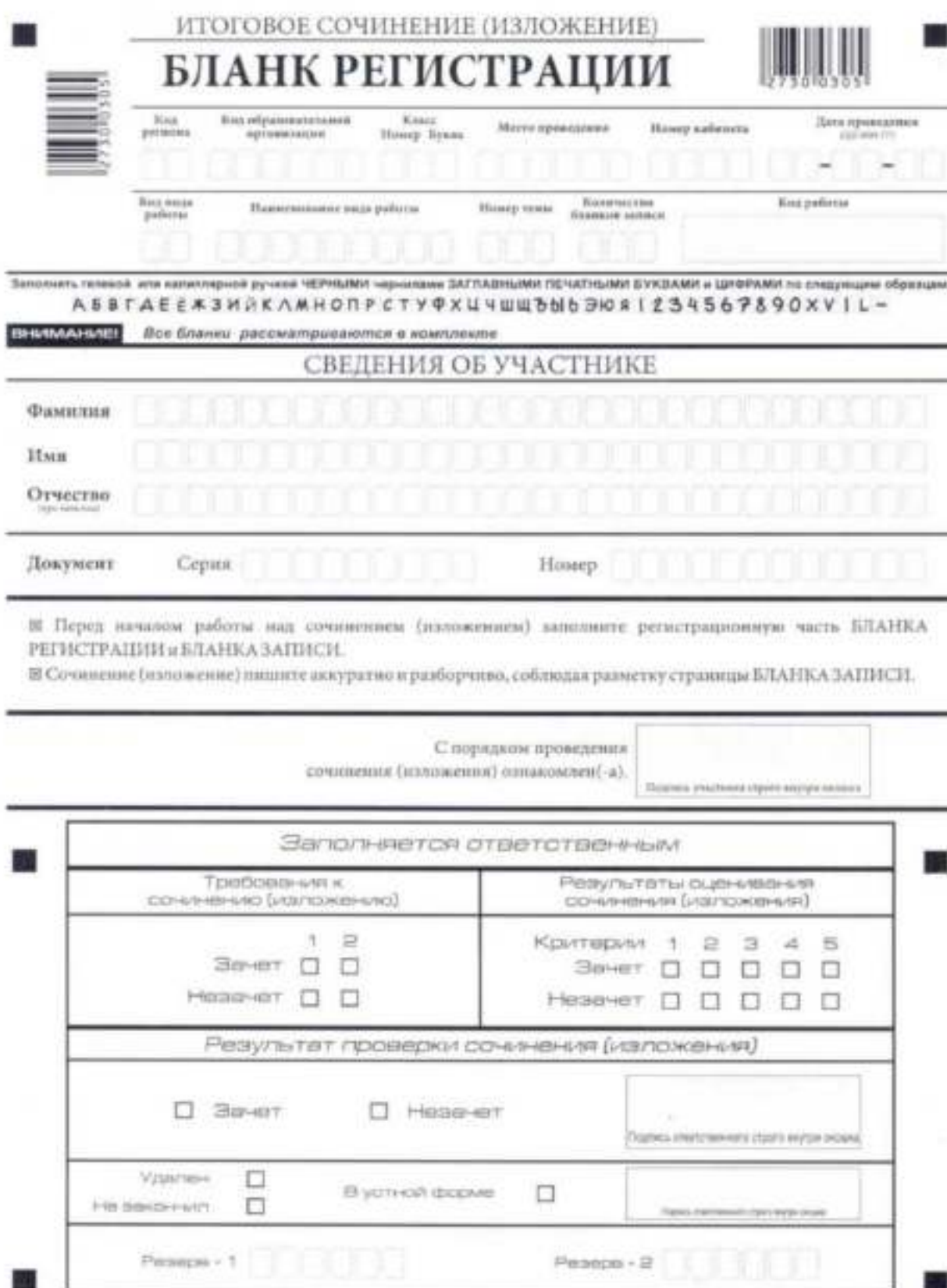
Рис. 1. Бланк регистрации