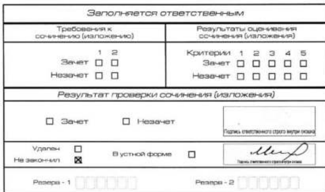
Рис. 12. Заполнение полей нижней части бланка регистрации (завершение написания сочинения (изложения) по уважительным причинам)