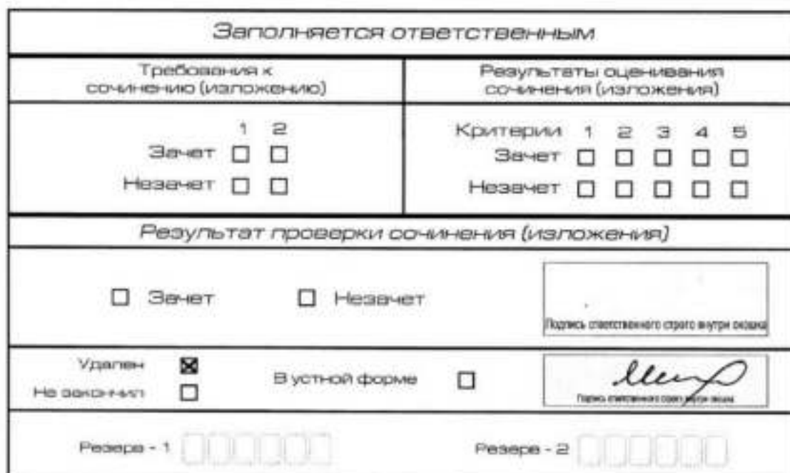
Рис. 13. Заполнение полей нижней части бланка регистрации (удаление с экзамена)