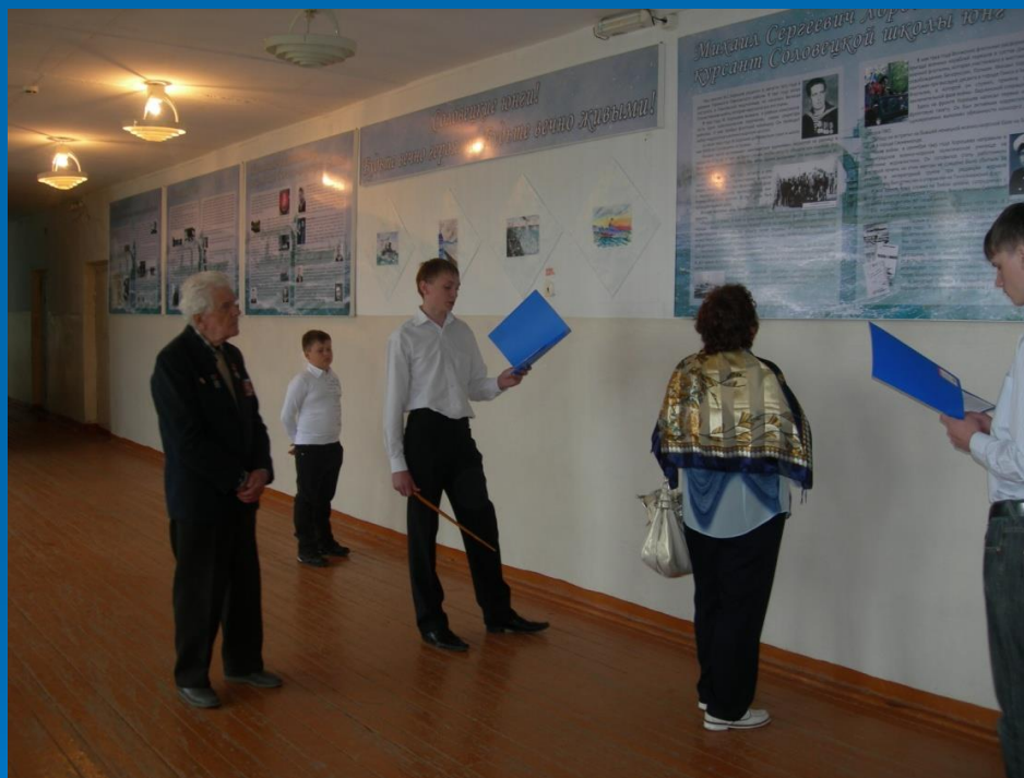
Открытие экспозиции «Соловецкие юнги». Таремская школа. 2012 г.