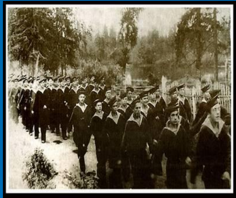
Первый набор школы юнг. Лето 1942год.