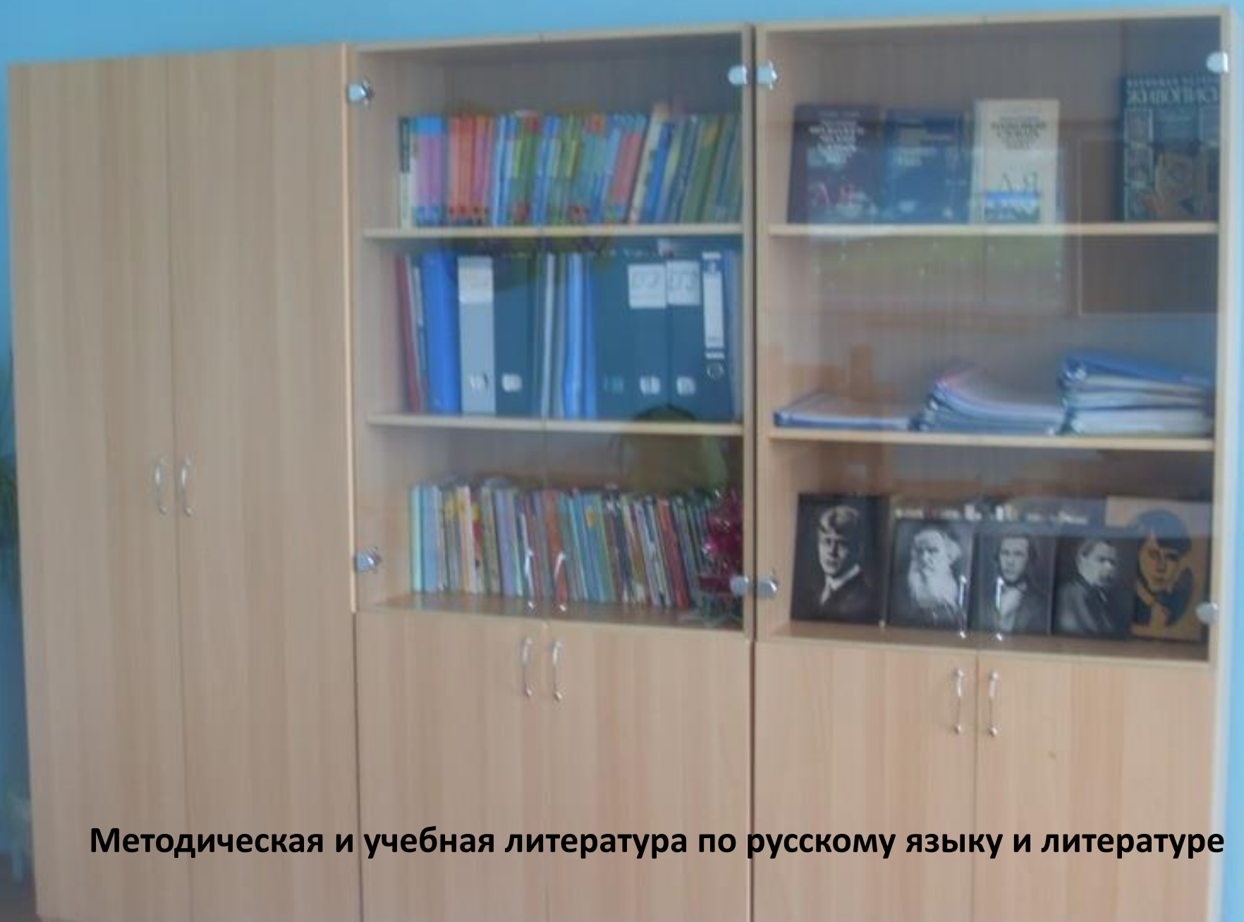
Методическая и учебная литература по русскому языку и литературе