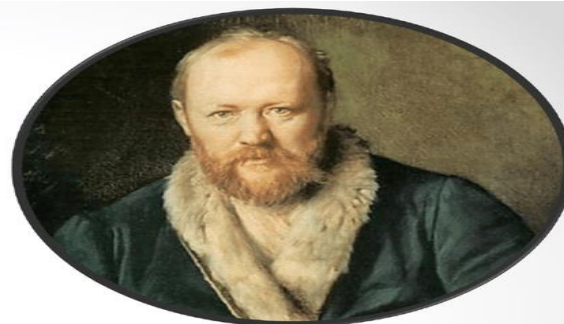
Александр Островский (1823-1886)