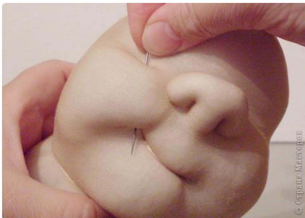
14. Выделяем подбородок.