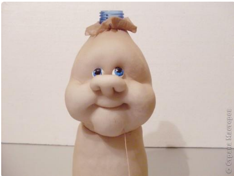
16. Формируем брови.