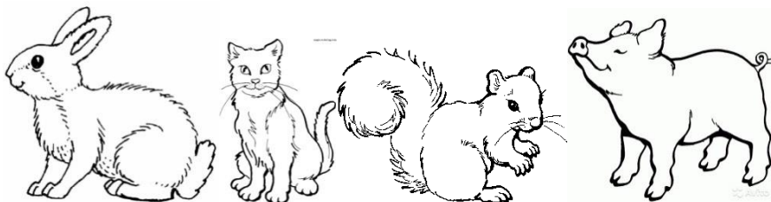
БЕЛКА СВИНЬЯ ЗАЯЦ КОШКА

4. По картинкам определи названия животных (укажи стрелками)