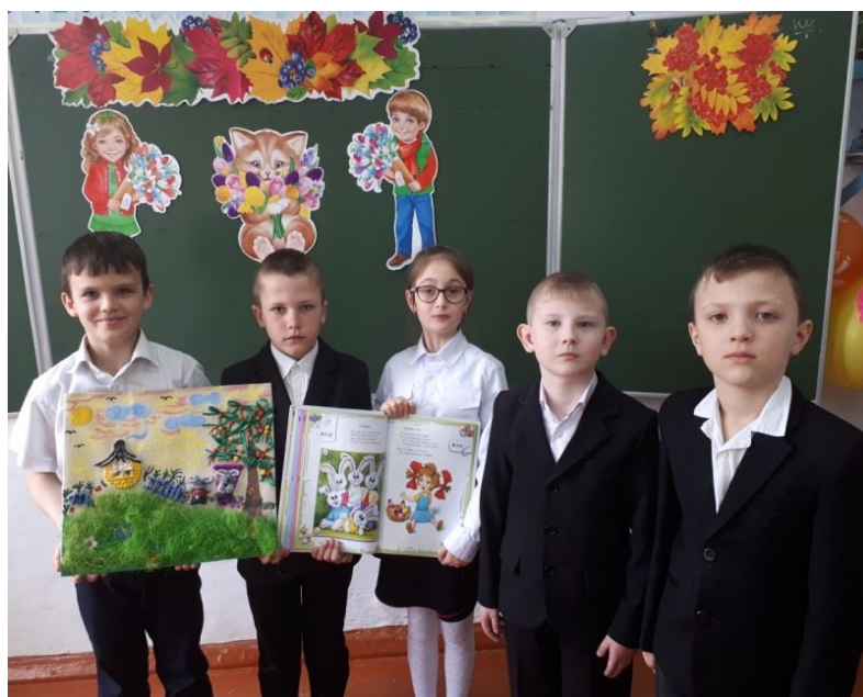
Библиотечный урок «Читаем сказки вместе»