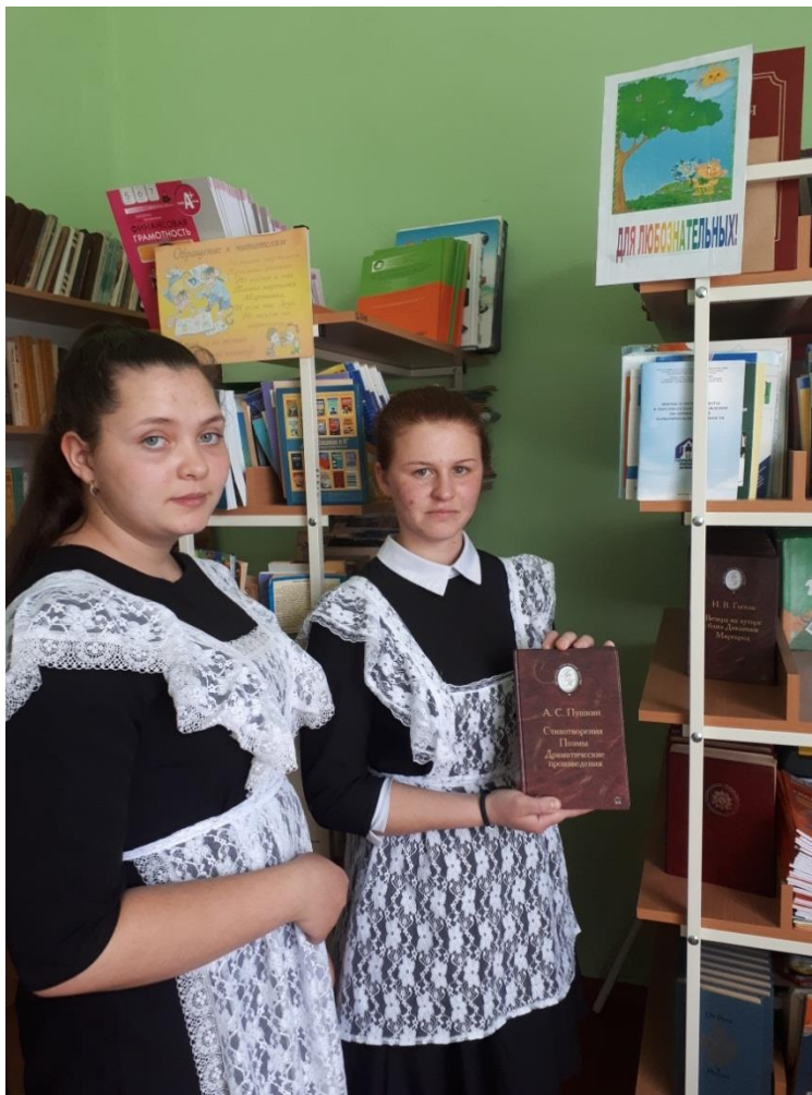
Библиотечный урок «Русская классика поможет подготовиться к ОГЭ»