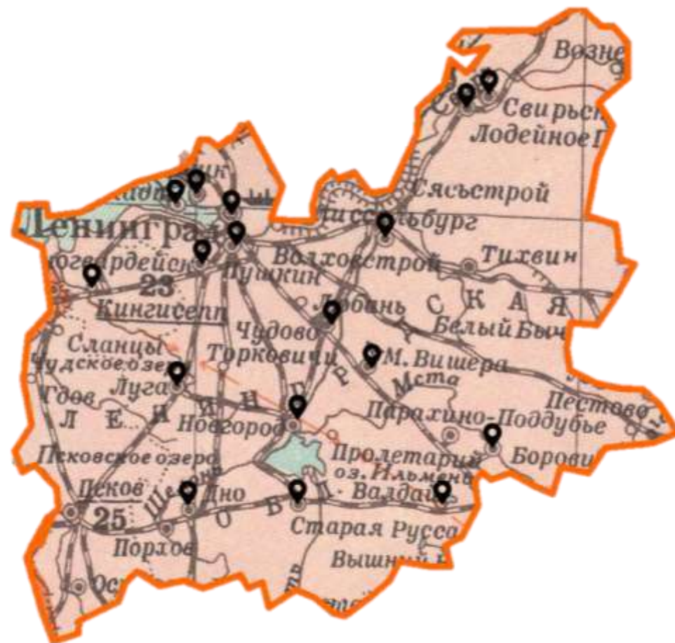
Карта Ленинградской области, 1939 г.