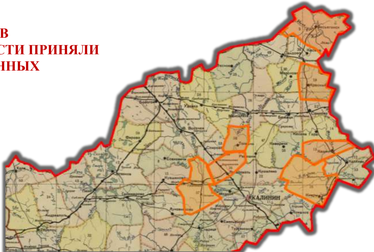
Карта Калининской области, 1935 г.

7 РАЙОНОВ КАЛИНИНСКОЙ ОБЛАСТИ ПРИНЯЛИ ЭВАКУИРОВАННЫХ