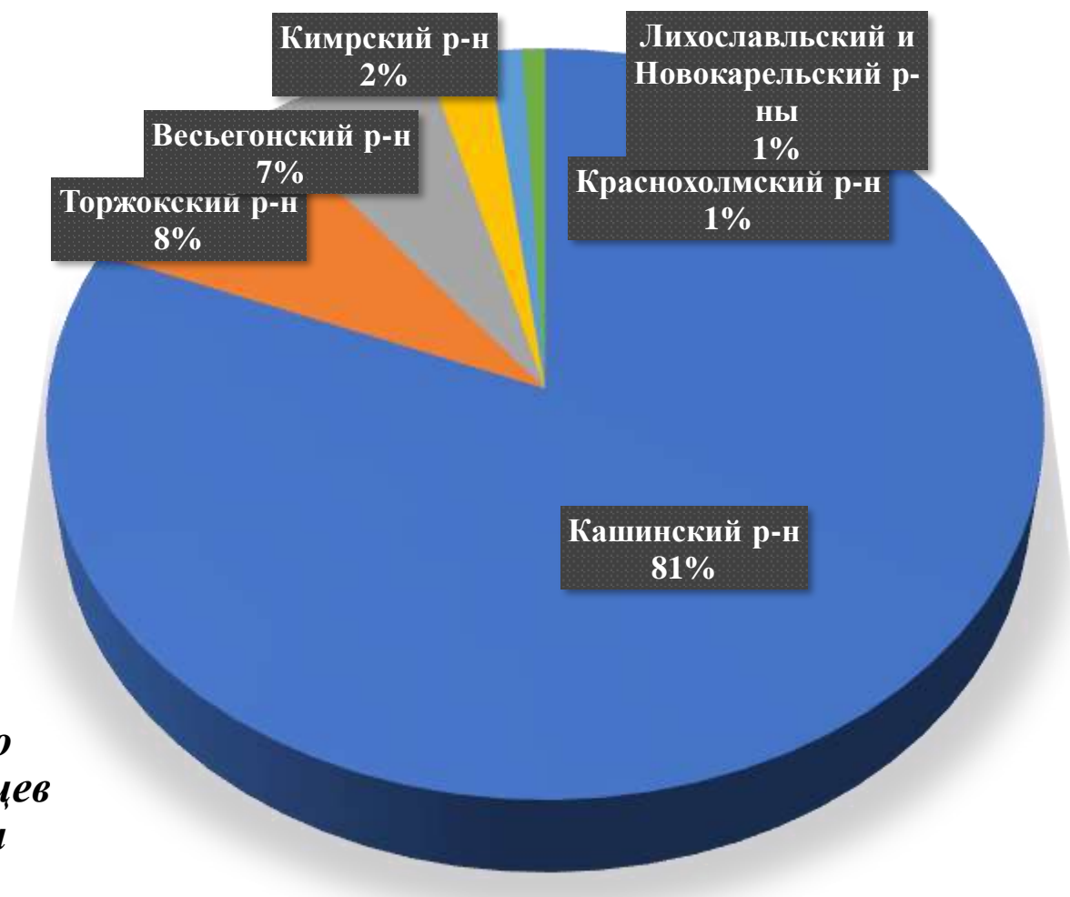
Диаграмма порайонного распределения ленинградцев в Калининской области