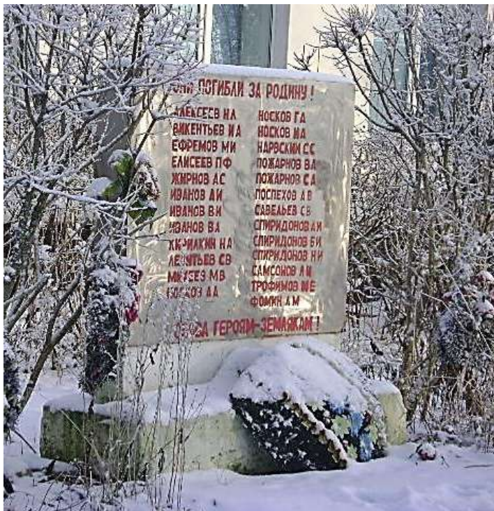
Мемориал погибшим за Родину землякам. Кингисеппский район, дер. Пустомержа.