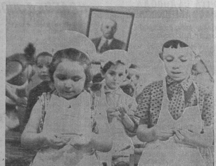
Дети завода «Кузбассрадио». На занятии по трудовому воспитанию в старшей группе.