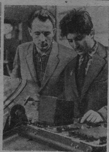
ОГСК. Содержательна и плодотворна деятельность бюро экспериментальных работ Южуралмашзавода.

Интересы дела требуют, чтобы наши народные дружины работали активнее. Необходимо шире применять обмен опытом. Необходимо, чтобы основным в работе дружин стали методы убеждения, воспитания.