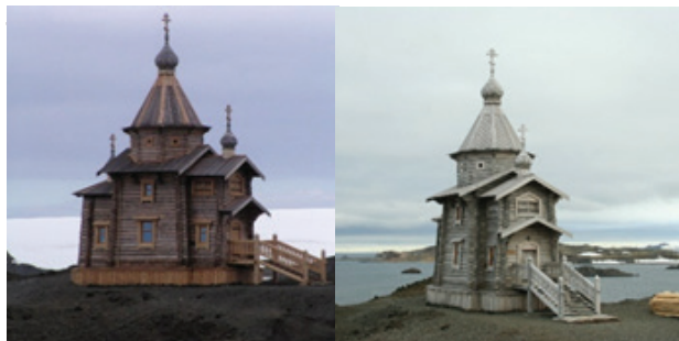
Рис 1. Храм Святой Троицы в Антарктиде. Фото Е. Резцова 2004 и 2006 гг.