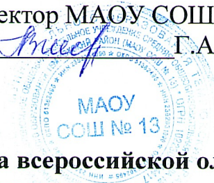
График и места проведения школьного этапа всероссийской олимпиады школьников в МАОУ СОШ №13 в 2022-2023 учебном году