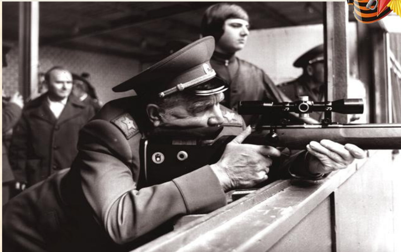
Чуйков испытывает оружие