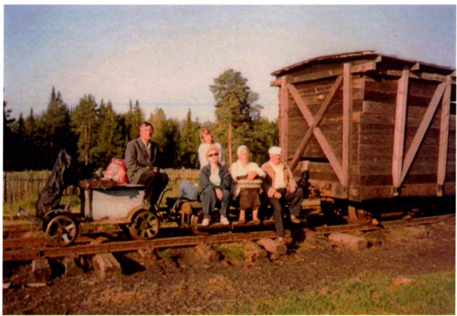
п. Бородинка. На «пионерке» готовятся к отъезду