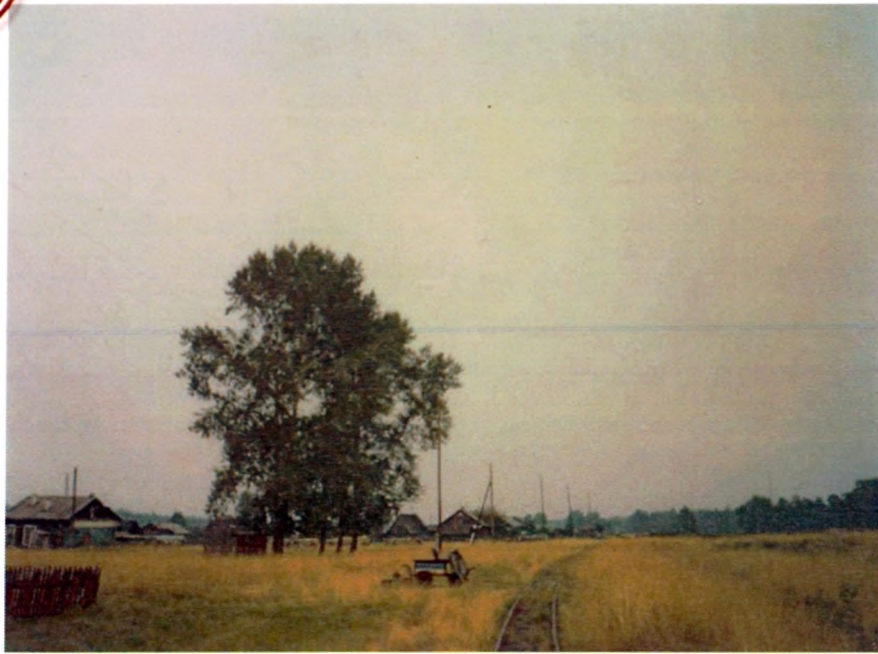
2010 год. Въезд на Бородинку

Деревня моя, деревянная дальняя Смотрю на тебя я прикрывшись рукой