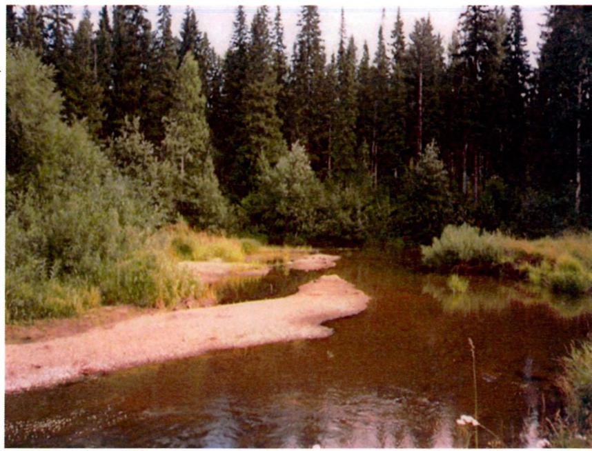
2010 год. п. Бородинка. Вид на реку Выя со стороны Игошиных

Ты в легком платочке июньского облака в веснушка черемух, стоишь над рекой