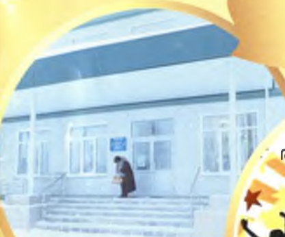
МБОУ ДОД «Детская школа искусств»