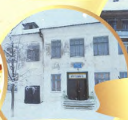
детский сад №22