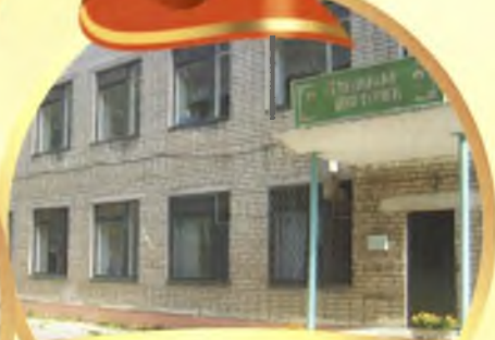
детский сад №7