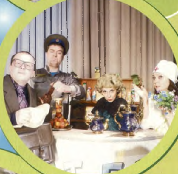
Вокальный ансамбль «Дежавю»