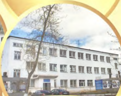
Красноуральский многопрофильный техникум