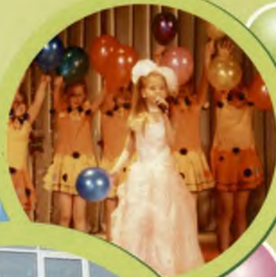
Образцовый ансамбль танца «Виктория»

Сегодня во Дворце культуры работают следующие творческие коллективы: народный хор русской песни «Рябинушка», фольклорный ансамбль «Озорники», образцовый ансамбль танца «Виктория», танцевальный коллектив «Светлячки», коллектив бальных танцев «Кредо», коллектив бальных танцев «Ренессанс», вокальный ансамбль «Дежавю», вокальный коллектив «Арт-вокал», фольклорный ансамбль «Сударушка», вокальный коллектив «Радуга»