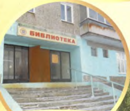
Центральная детская библиотека