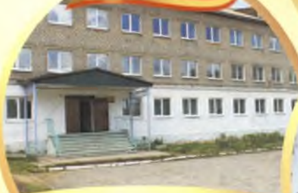
Красноуральский детский дом