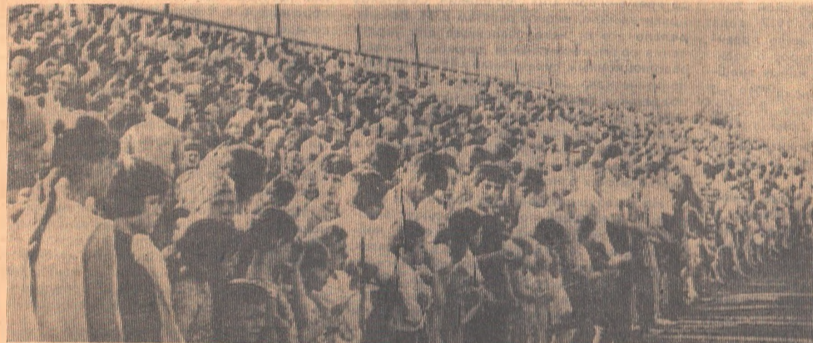
На трибунах — обилие людей, упрямых