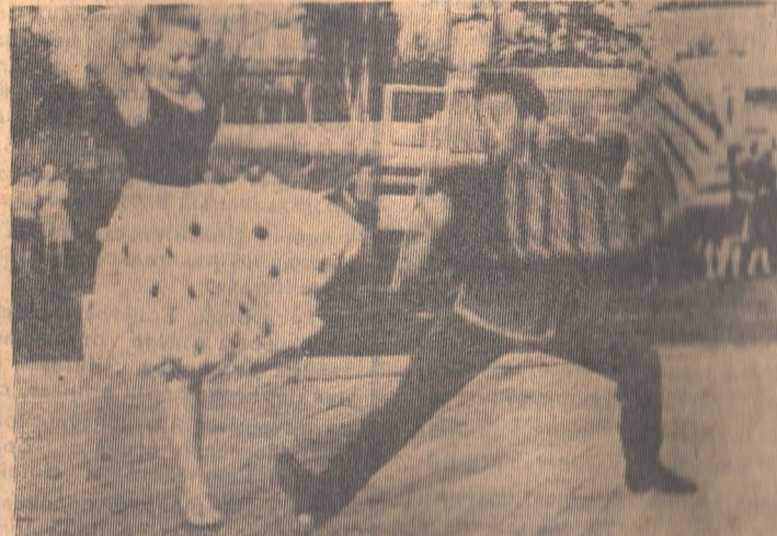
Танцуют марионетки, доисты