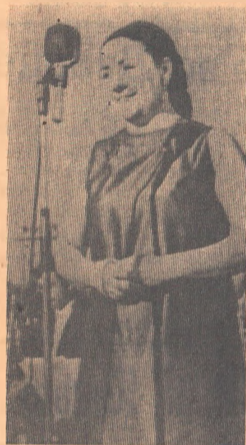
Свердловчанка — красноуральцам

— Этот ветер навеивает мелодии, взволновала сердце каждого слушателя. Казалось, в песне слился весь мир: каждый приговор родной земли, каждая березка, бескрайность степей и холод тундры. Необычна наша Родина. Слова и мелодии песни говорят именно об этом. И еще об одном. «Ве-