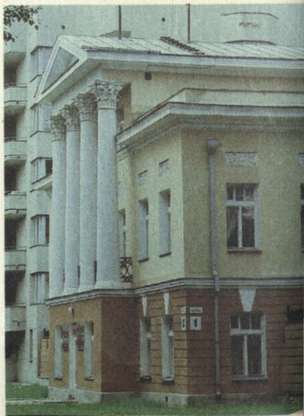
Особняк первой половины XIX в. (Набережная Рабочей молодежи, 2)