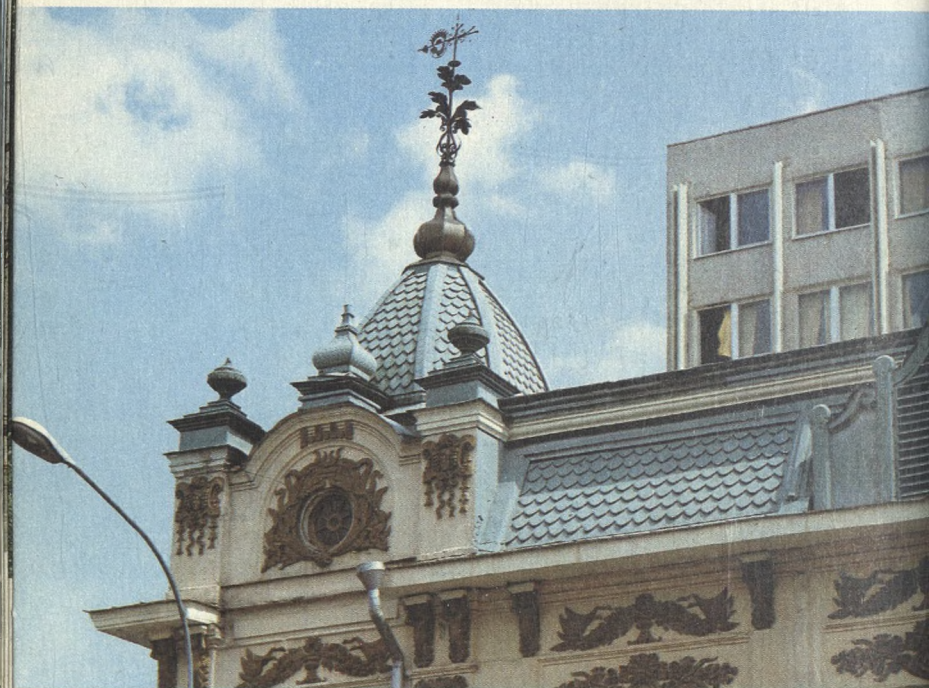
Декор особняка конца XIX в.