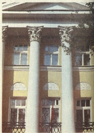
Портик особняка первой половины XIX в.