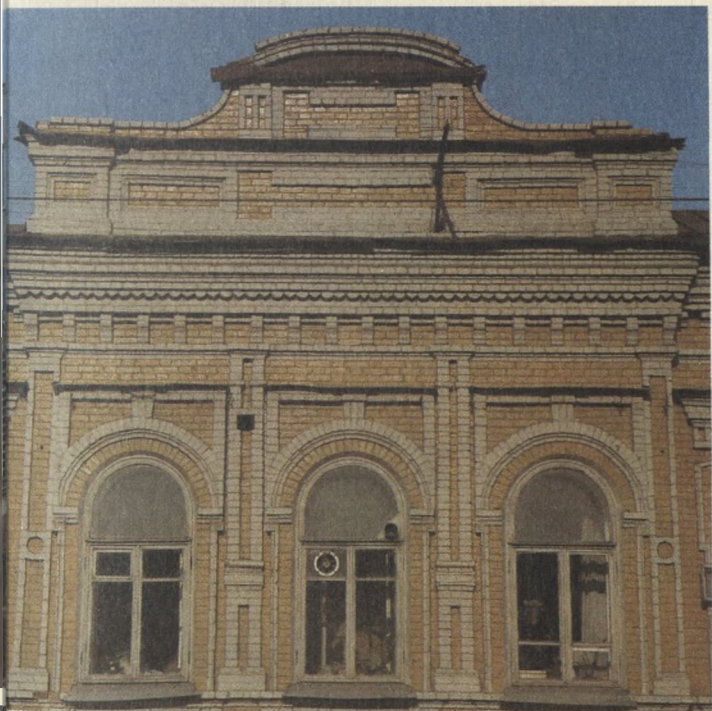
Образец кирпичного декора второй половины XIX в.