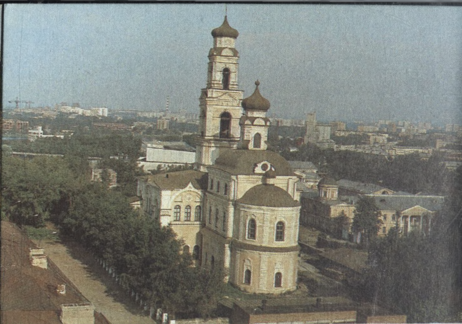
Вознесенская церковь, ныне здание краеведческого музея (Комсомольская площадь)