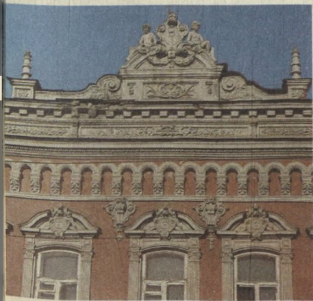
Декор здания второй половины XIX в.