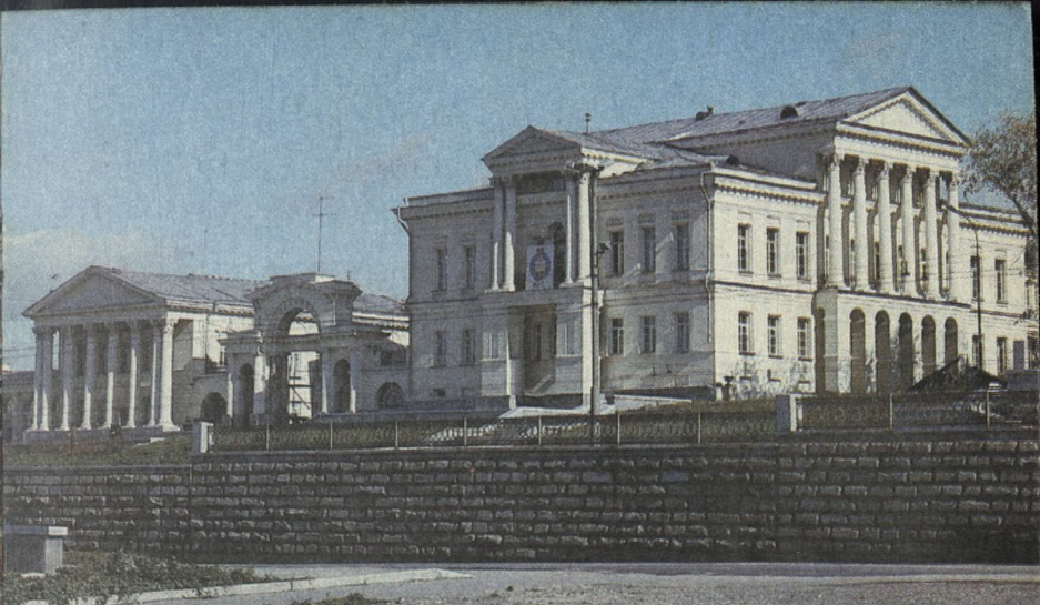
Усадьба Расторгуева — Харитонова, ныне Дворец пионеров (ул. К. Либкнехта, 44)

Бывшее Горное правление, ныне консерватория им. М. П. Мусоргского (пр. Ленина, 24)