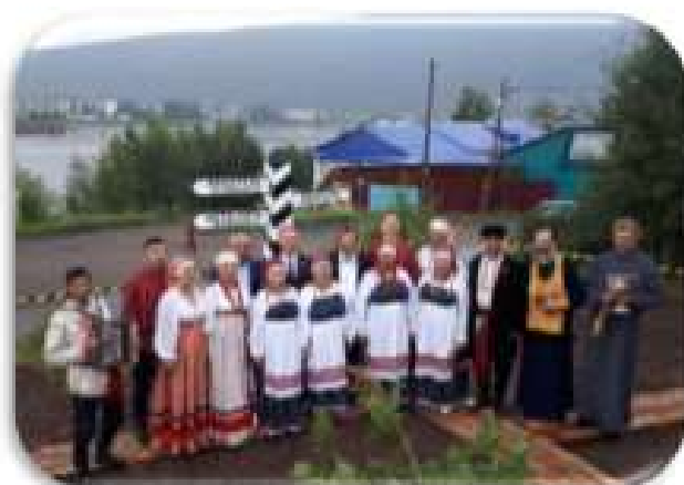
Верстовой столб Иркутско-Якутского почтового трака