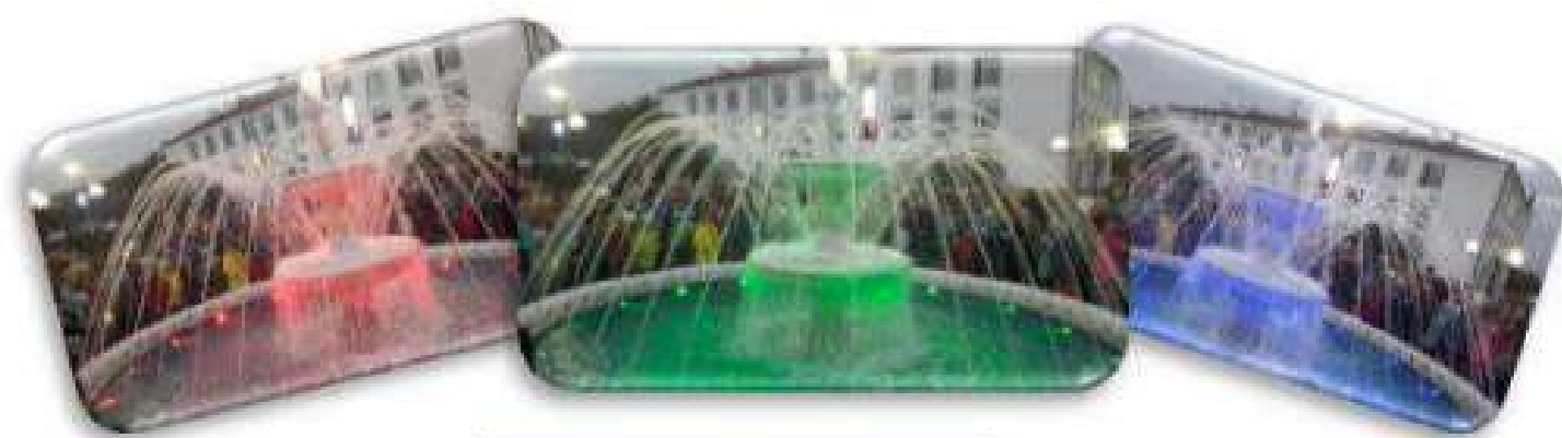
Фонтан в сквере «Свободы»