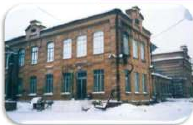
Один из корпусов винокуренного завода