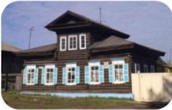
Дом декабриста Валериана Голицына