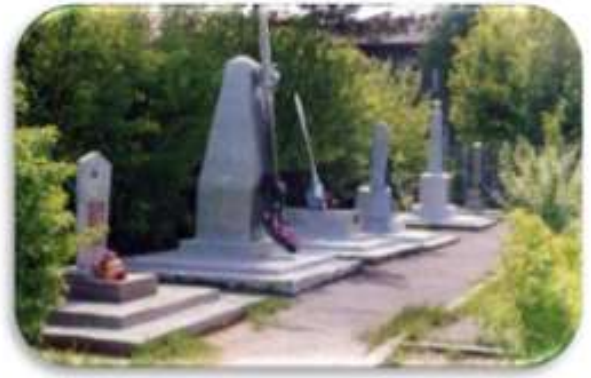
Захоронение героев гражданской войны, летчиков авианеперегоночной трассы АЛСИБ