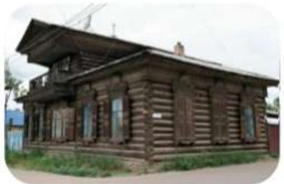
Дом с мезонином