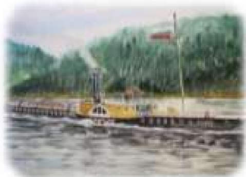
1-й пароход св. Тихон Задонский

1890г. – образование родоначальника ленского флота – затона Глотова.