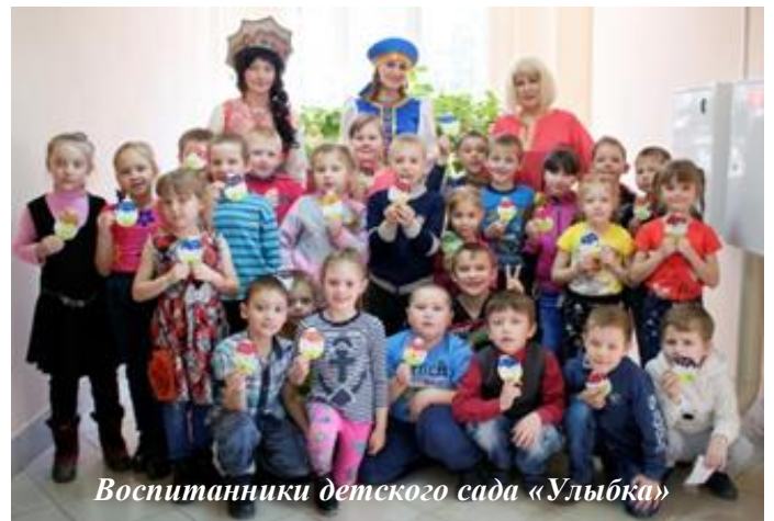
Воспитанники детского сада «Улыбка»