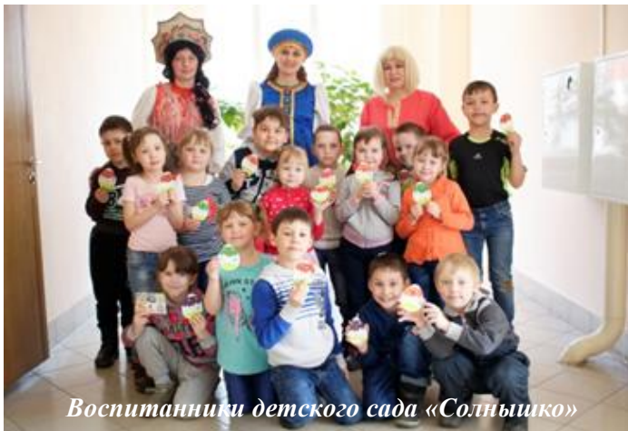
Воспитанники детского сада «Солнышко»