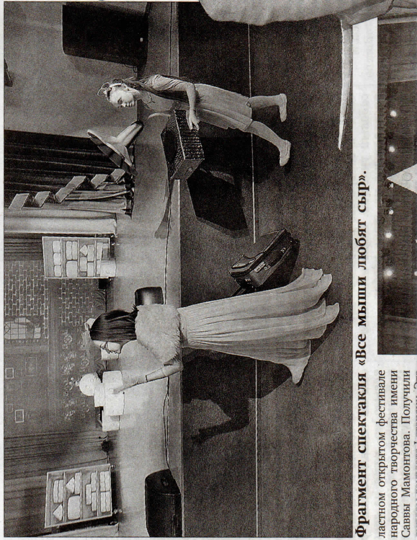
Фрагмент спектакля «Все мыши любят сыр».

— Знаете, меня ведь уже об этом спрашивали, — озадачивает ответом. — Когда мы были на фестивале, после спектакля по-