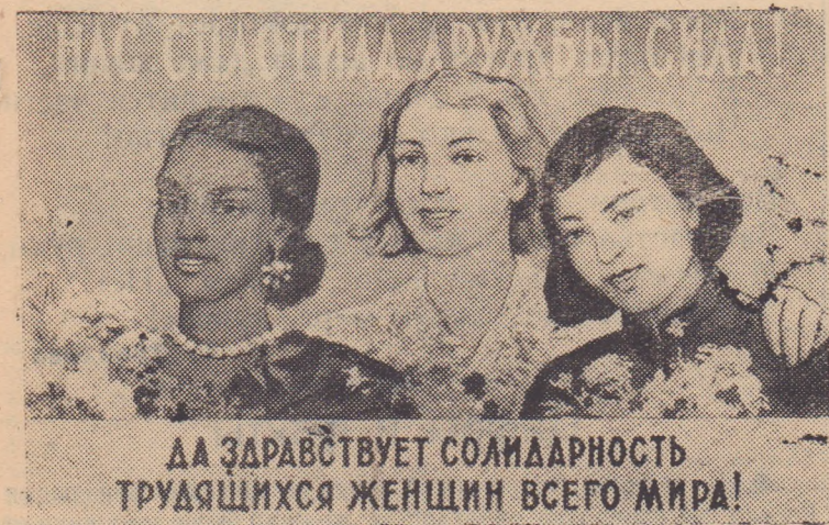
Плакат работы художника Р. Савостюк (Государственное издательство изобразительного искусства).