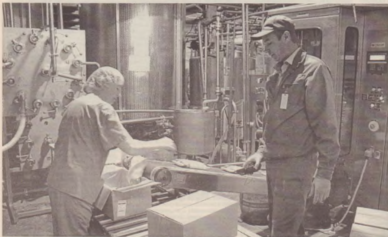
● Идёт фасовка молока в пакеты.

потребителя часть нашей продукции идёт в прозрачной упаковке. Люди должны видеть, что они покупают.