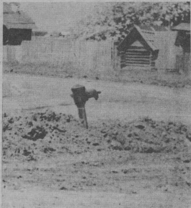
Эта водоразборная колонка стоит в центре села Черемхово. Ее появление осенью прошлого года жители встретили с радостью и надеждой: наконец-то решится

вопрос с водой. Но заморозили осенние дожди, выпал и растаял зимний снег, и вместе со снегом таяли надежды черемховцев. Вот уже и годовая юбилей появления колонки скоро можно будет справлять.