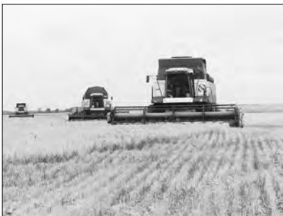
Уборка зерновых в ПАО «Каменское»

В Каменском районе зерновые убраны в полном объеме, в этом сезоне намолочено в бункерном весе 34,7 тыс. т, урожайность – 22,8 ц/га (в 2018 г. – 20,4 ц/га). Валовое производство картофеля составило 37,7 тыс. т при средней урожайности 150 ц/га. Произведено 3 тыс. т овощей, 2,2 тыс. т технических культур.