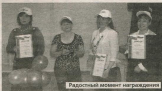
Радостный момент награждения

Весьма интересный этап конкурса — разрешение психологической ситуации. Например, участницам предлагался случай: «Если к вам в библиотеку пришел иностранец...», или «Утром в библиотеке вы вдруг обнаружили спящего посетителя». Здесь все конкурсантки смогли найти весьма оригинальные решения проблем.