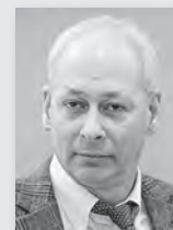
Алексей Волин, заместитель министра связи и массовых коммуникаций РФ

Замглавы Минкомсвязи Алексей Волин признал, что в настоящее время даже такие крупные издания, как «Российская газета», «не тянут» тарифы ФГУП «Почта России». В связи с этим, сообщил он, в настоящее время министерство прорабатывает вопрос альтернативного распространения печатных СМИ.