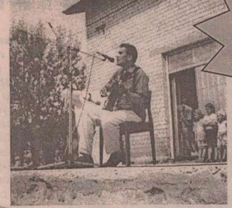
ФОТО-эхо ДНЯ МОЛОДЕЖИ. ДАРЕНИЕ ПОДАРКОВ, ПЕНИЕ ПЕСЕН, ТАНЦЕВАНИЕ ТАНЦЕВ.