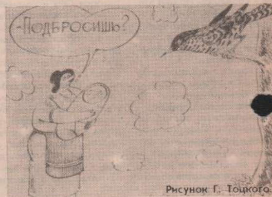
Рисунок Г. Тоцкого.