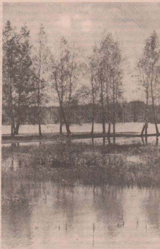
Леса в листву облачены. С земли ушла зима. Все в белом цвете. У весны работ различных тьма.