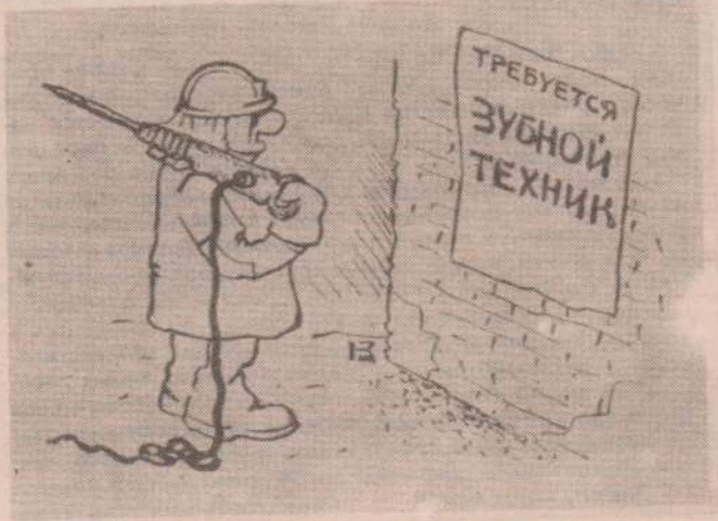
Рисунок М. Кузьмина.