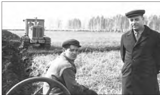
В совхозе «Травянский» идет пахота

Так, 11 апреля 1957 г. из Каменской МТС и нескольких колхозов, находящихся вблизи Каменска-Уральского, был создан первый в нашем районе большой совхоз «Каменский». Он первоначально состоял из 15 отделений. Центральное отделение совхоза №1 размещалось в Беловодье. Площадь вновь образованного совхоза была обширна: земли совхоза располагались по берегам рек Исети, Каменки, Истока. Конечно, руководить таким огромным совхозом оказалось очень сложно, поэтому в ноябре 1957 г. совхоз был разукрупнен на «Каменский» и «Бродовской». 21 апреля 1958 г. на базе Маминской МТС и 3-х прилегающих колхозов