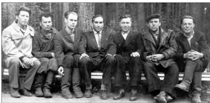
Делегаты совхоза «Мамино» на совещании в Свердловске

областных выставках, семинарах и совещаниях. Эти новшества пропагандировались по Свердловскому и Центральному телевидению, Московской киностудией. Вот таким самородком-изобретателем и хорошим организатором был первый