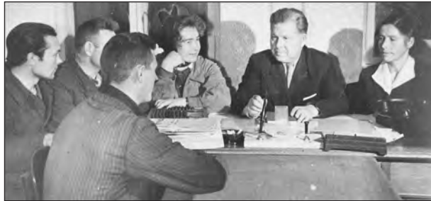
Рабочее совещание в совхозе «Бродовской»

Строительные цеха были во всех совхозах. Их возглавляли старшие прорабы. Они строили и проводили текущие и капитальные ремонты хозяйственным способом. С целью экономии и эффективности