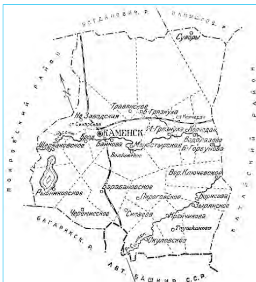
Карта Каменского района. 1928 г.

Указом Президиума Верховного Совета РСФСР от 15 июня 1942 г. Каменск-Уральский, Каменский и Покровский районы выделены из Челябинской области и включены в состав Свердловской области.