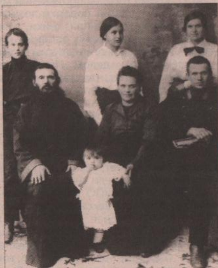
Жители села Колчедана

Колчеданский музей давно перерос статус школьного. Имея огромный архивный материал, который пользуются все жители села, он, конечно же, должен находиться в более просторном и доступном для посетителей месте. Мы бы хотели, чтобы руководство школы более внимательно подошло к вопросу сокращения ставки руководителя музея. Ведь без человека, отдающего всего себя любимому делу, вряд ли наш уже общенародный музей будет жить!