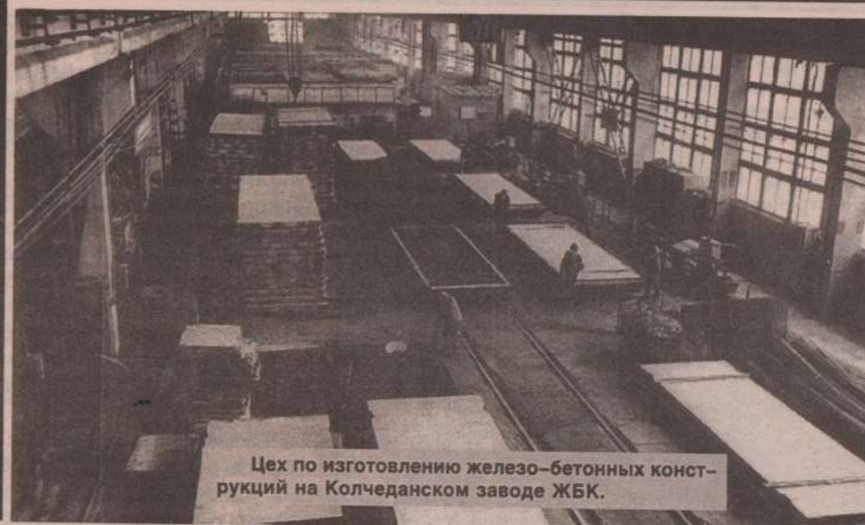
Цех по изготовлению железо-бетонных конструкций на Колчеданском заводе ЖБК.