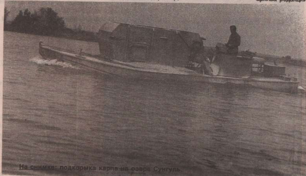
На снимке: подкормка карпа на озере Сунгуль.

М. Терентьева, ведущий специалист райархива.