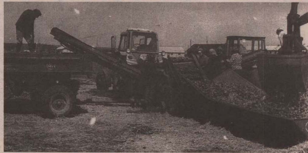
На снимке: сортировка картофеля в совхозе им. Ленина.