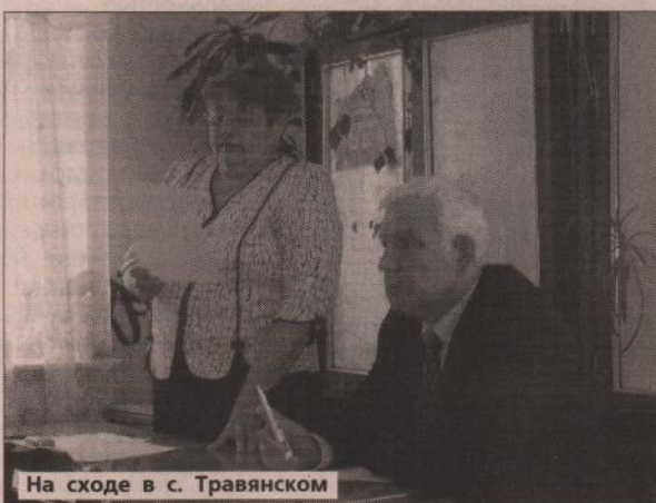
На сходе в с. Травянском

– В свое время отдали «Мясной компании» около 4 тысяч га земли с лесами, бо-