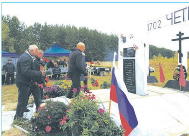
Деревни нет, но люди приезжают на землю, где они родились