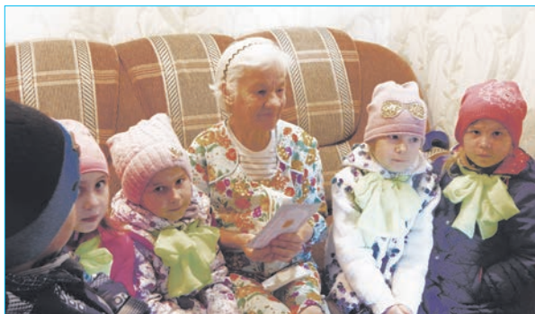
Дети из Бродовского детского сада навестили ветеранов