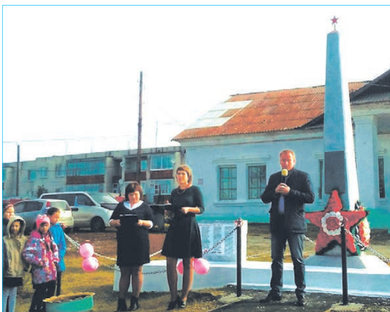
У обновленного обелиска в Кисловском прошел митинг памяти