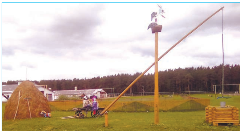
На фото: элементы дизайна на территории ПАО «Каменское»