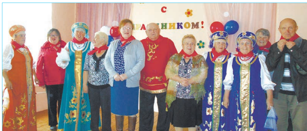
Праздник вернул в годы молодости