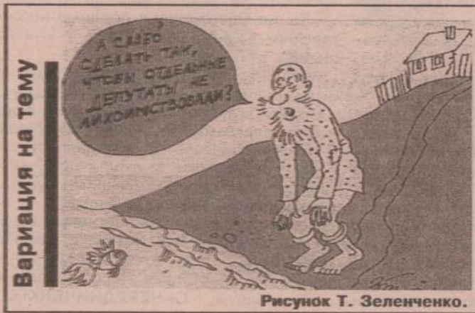
Рисунок Т. Зеленченко.

Премьера - сорт получен на Свердловской опытной станции садоводства. Куст среднерослый, почти компактный, рыхлый. Высокая зимостойкость и самоплодность обеспечивают стабильную урожайность. Срок цветения и созревания - средний. В отдельные годы может незначительно повреждаться мучнистой росой и почковым клещом. Кисти короткие с неплотным расположением ягод. Ягоды черные, округлой формы, сравнительно одномерные (1,2-2,4 г), очень приятного десертного вкуса.