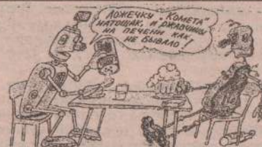
Рис. В. Иванова.