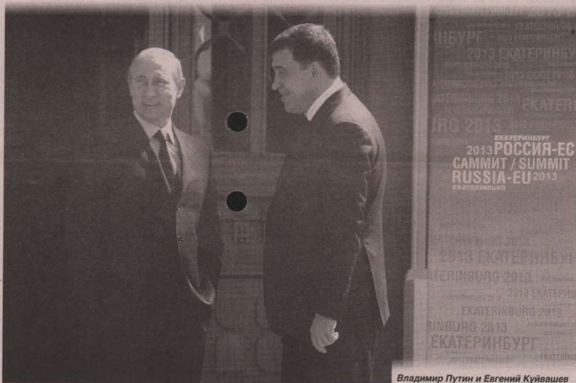
Владимир Путин и Евгений Куйвашев

Губернатор Свердловской области Евгений Куйвашев перед заседанием саммита Россия - ЕС встретил Президента РФ Владимира Путина и европейскую делегацию Европейского совета и Еврокомиссии.