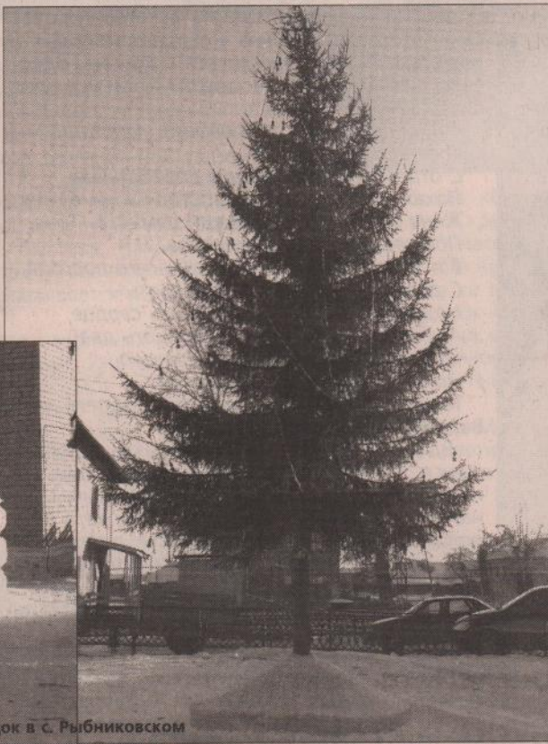
Елочный городок в с. Рыбниковском