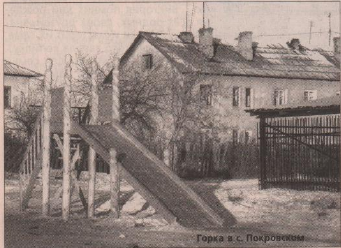
Горка в с. Покровском