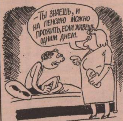
Рис. Л. ЧЕРНЫХ.