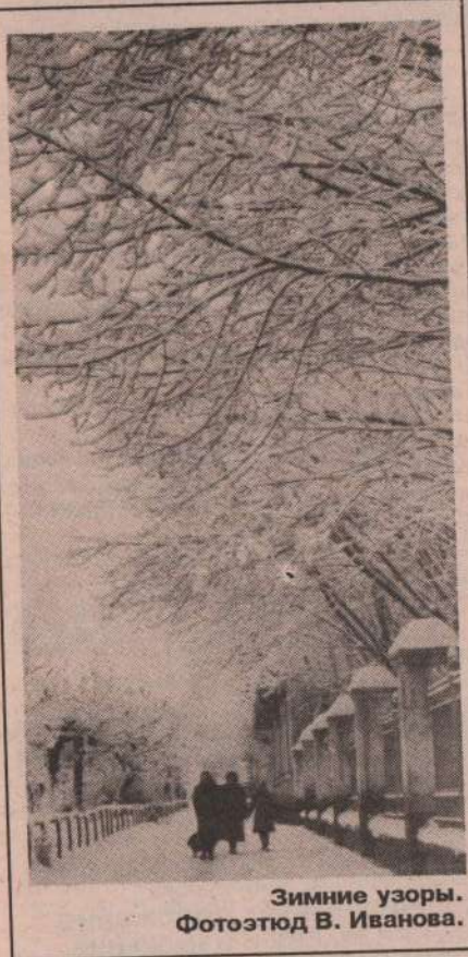
Зимние узоры.