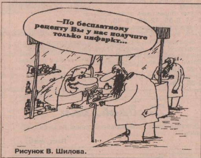
Рисунок В. Шиловой.